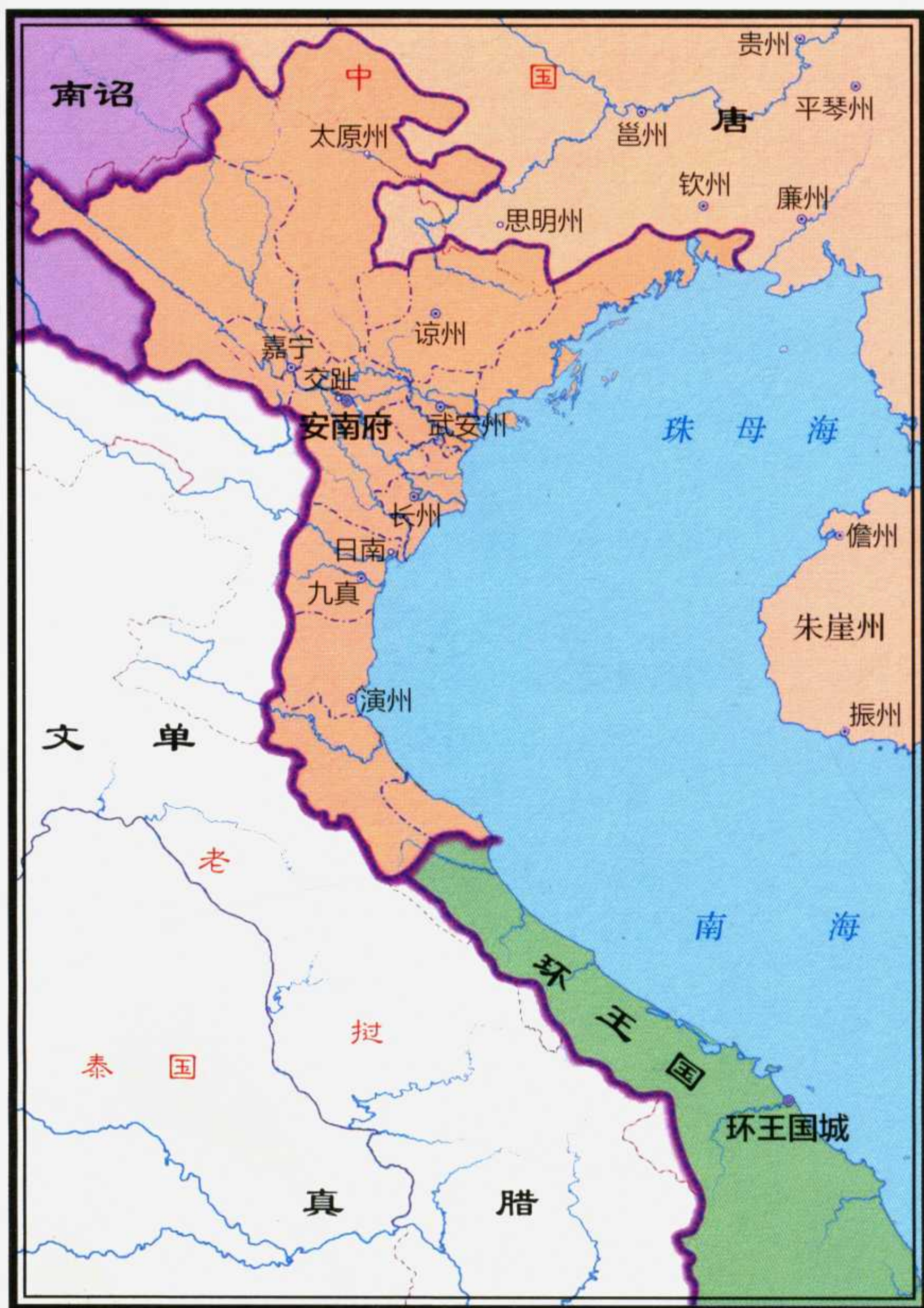
◎ 唐咸通元年（860年）安南都护府全图

唐末五代混战不休，安南也不例外。刘隐割据广州，曲颢割据交州。后梁篡唐后，朱温任命刘隐兼任静海军节度使、安南都护。刘隐死后，其弟刘勳袭位，六年后称帝，国号“大越”，后改为“汉”，史称“南汉”。不久，南汉进兵交州，灭曲承美。曲氏部将杨延艺（一作杨廷艺）驱逐南汉派遣的交州刺史，自称节度使，后为部将矫公羨所杀。杨延艺之婿吴权起兵攻矫公羨，矫公