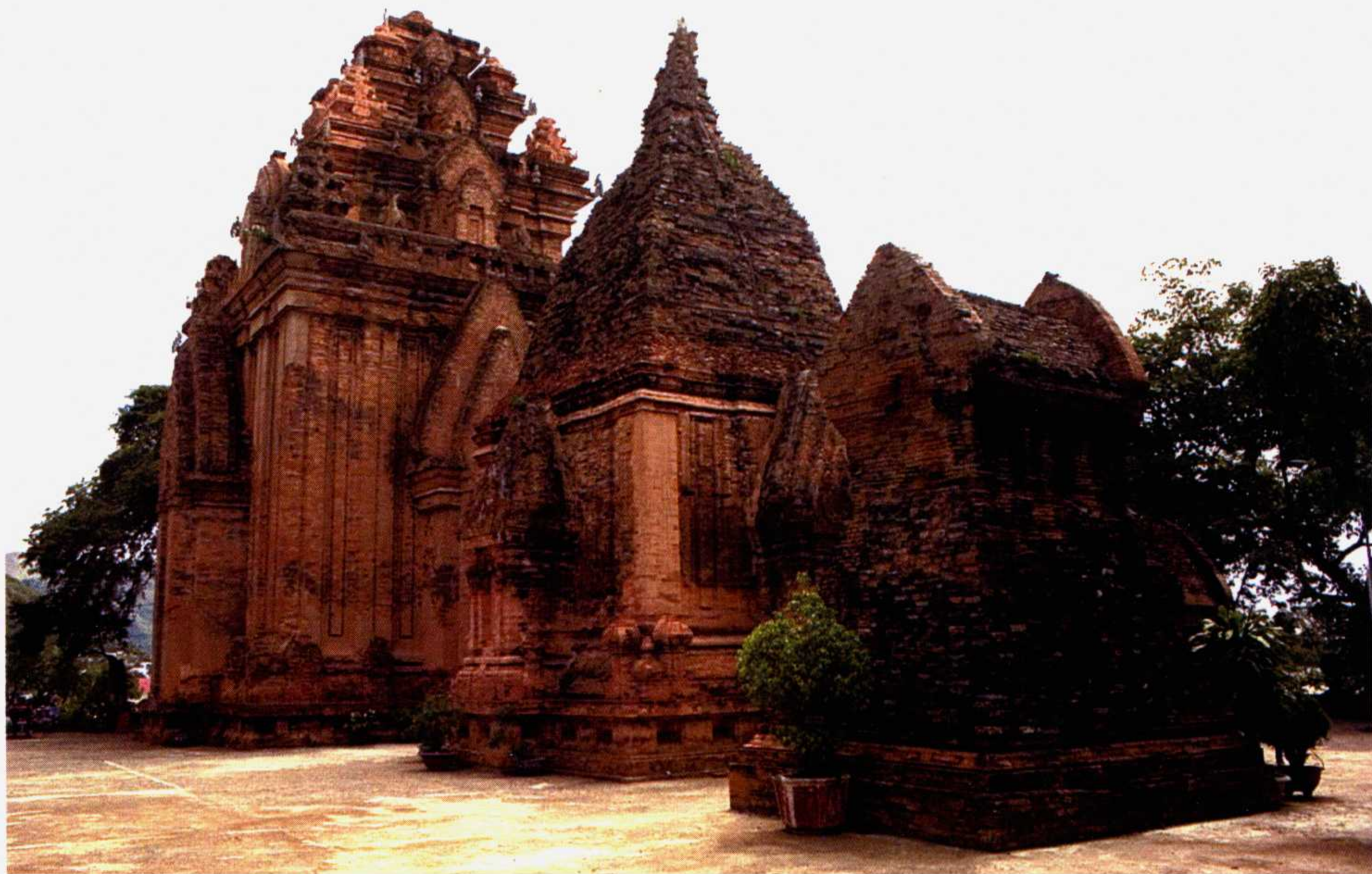
◎ 占城国遗址，婆那加占婆塔

为试探明朝的态度，洪武五年（1372年）二月，陈叔明派使者阮汝霖入贡。但他并没有走正常途径向明朝求封，而是在进贡表文中以自己之名代替陈日燿，意图蒙混过关，但被礼部主事曾鲁发现。在曾鲁的责问下，阮汝霖不得不说出安南政权更替的实情。朱元璋得知其企图后十分愤怒，拒绝接受贡物，并严厉斥责了陈叔明篡位的叛逆行为。陈叔明也许是迫于明朝的压力，在十一月初九禅位于弟陈端（睿宗陈暉），并再次派使者入明谢罪请封。陈叔明虽然已经让位，但仍掌握着安南的