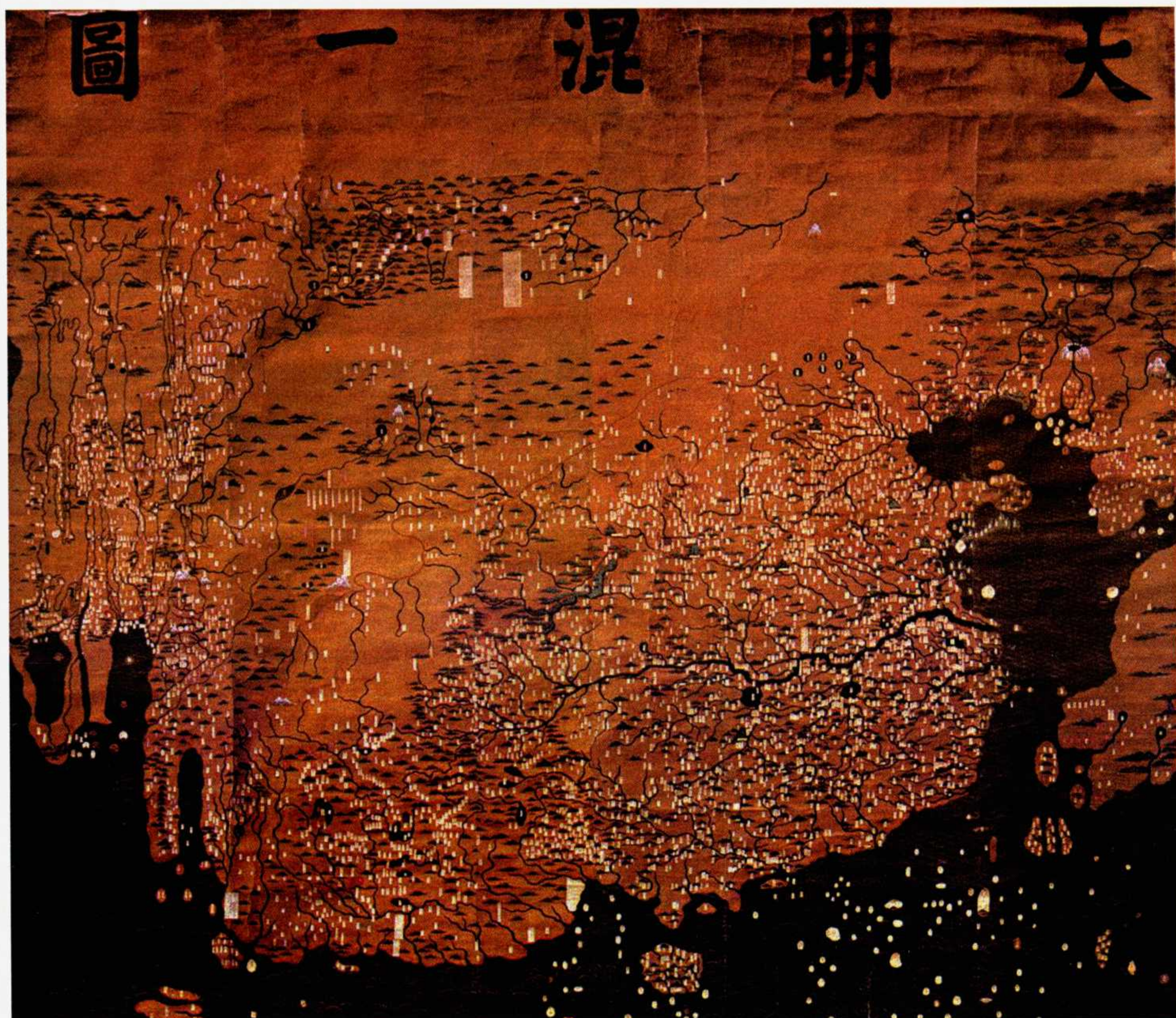
◎ 大明混一图（彩绘绢本）

问罪安南的原因。但传闻毕竟是传闻，其实，明帝国出兵的直接原因是胡氏立国后意图在西南称霸，多次侵掠明帝国西南边境地区。比如，安南曾侵占广西思明府的禄州、西平州、永平寨等地，之后又于永乐三年（1405年）侵掠云南宁远州（今越南莱州），甚至还伏击护送陈氏子弟归国的明军。对这一系列挑衅行为，明帝国自然不能坐视不理。除此之外，可能还有一个原因：朱棣有恢复安南这块中华故土的雄心。