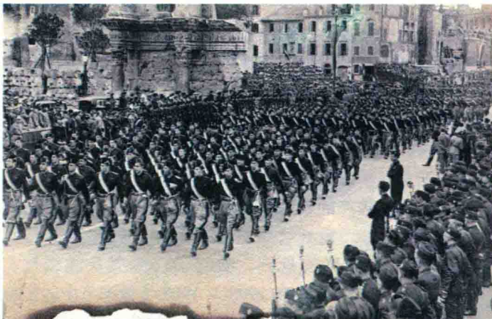
▲ 1935年10月，在罗马的一次凯旋游行期间，年轻的意大利法西斯主义者在墨索里尼面前齐刷刷地走过。

1915年8月31日，墨索里尼带着他的承诺奔赴战争的前线。他的勇猛与顽强助他很快当上了排长。