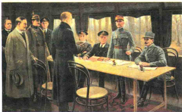
▲ 《贡比涅停战协定》的签署，宣告第一次世界大战结束。

1918年11月11日德国签署《贡比涅停战协定》，第一次世界大战宣告结束。战争结束后，战胜国便开始磋商召开缔结对德和约会议问题。会议地点最后定在法国巴黎。1919年1月18日，和平会议在著名的巴黎凡尔赛宫镜厅正式开幕，即为巴黎和会。