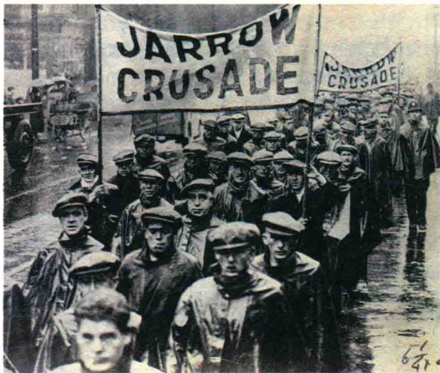
▲ 1930年10月，200名来自英国东北部贾罗地区的人，走上伦敦街头进行一次请愿游行。这使人们开始关注因贾罗船厂关闭而导致的大规模失业。

各国进行贸易战的手段是利用廉价商品对他国进行倾销，在金融领域，则纷纷采取放弃“金本位”，让本国货币贬值。带头的是英国，1931年9月英国银行停止英镑的金本位制，英镑大幅贬值。接着瑞典、挪威、日本等50多个国家争相效仿。整个国际信贷市场一片混乱。在这一过程中，出现了以某国为核心的集团化对抗。金融联系较为密切的国家组成了英镑集团、美元集团、日元集团等相互对立、封闭的货币集团。最终形成了国家集团对抗的局面。