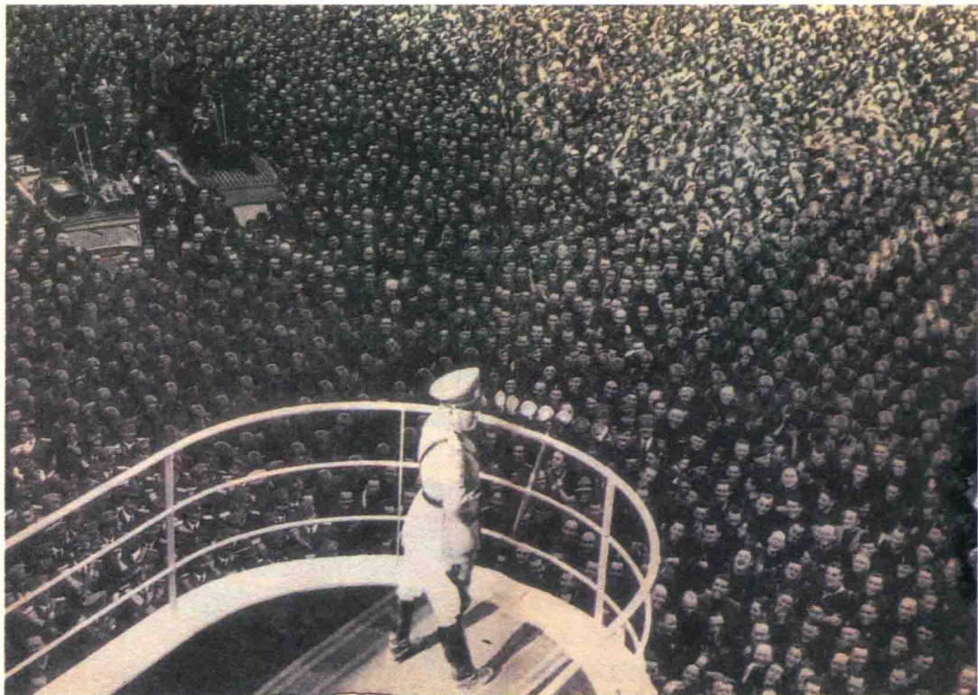
▲ 墨索里尼演讲。他的极具鼓惑的言论在当时赢得了民众盲目的支持。

势，因为真正参加行动的人数并没有吹嘘的多，再加上其简陋的装备，一旦政府抵抗，军队听从皇家的差遣，暴动便会轻而易举地被压制下去。但意大利国王和其他保守派集团则希望通过支持法西斯来驯服法西斯主义，这倒为夺权扫清了道路。