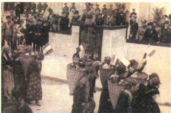
▲ 墨索里尼颁布新法令

1902~1908年，墨索里尼背井离乡，经历了各种各样的生活，当过泥瓦匠、脚夫、缝工、帮厨，但都不能持久。有时找不到活儿还得饿肚子。据说他当时曾以行乞和抢劫为生。幸亏侨居瑞士的意大利工人经常给他一些接济，帮他渡过难关。后来在朋友的帮助下，墨索里尼同意大利社会党人在洛桑主办的《劳动者前途报》拉上了关系，成为该报记者，开始了他的记者生涯。根据社会党的要求，墨索里尼经常向侨居瑞士