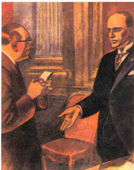
▲ 墨索里尼被任命为意大利总理

1922年墨索里尼向政府提出：要么解散政府，要么组建包括法西斯党在内的联合政府，但都遭到了