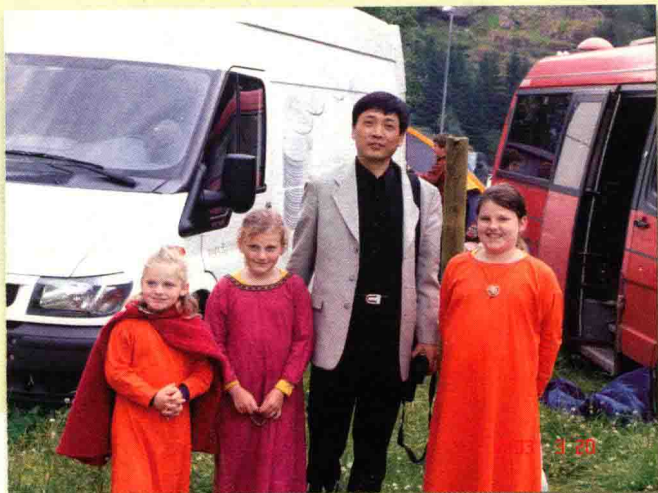
2005年7月在挪威海盗节