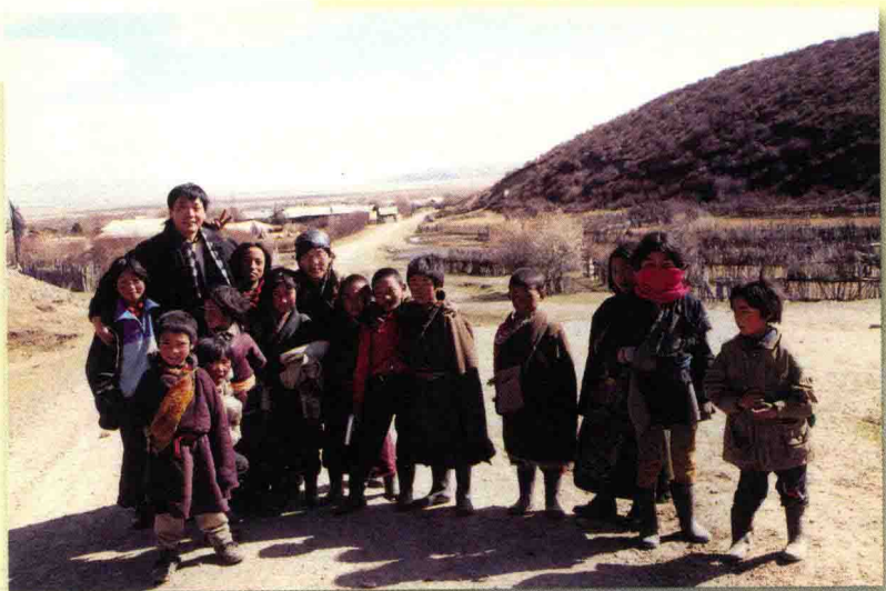
2000年10月与藏族孩子在一起