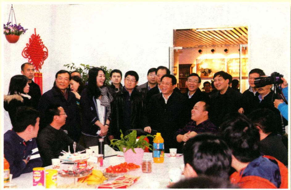
2015年2月26日，浙江省省长李强在杭州调研梦想小镇建设，与正在举行创想会的部分年轻CEO交流。