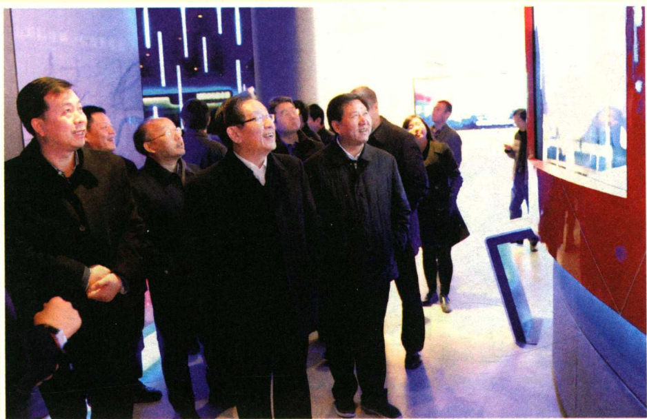
2014年12月19日，全国政协副主席、科技部部长万钢考察青山湖科技城。