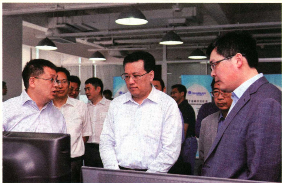
2015年5月4日，浙江省委常委、常务副省长袁家军考察调研未来科技城浙江神州量子网络技术公司。