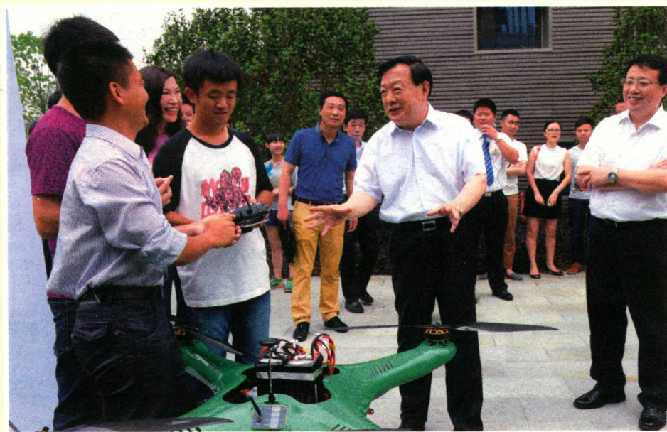
2015年6月2日，浙江省委书记夏宝龙在杭州梦想小镇考察。