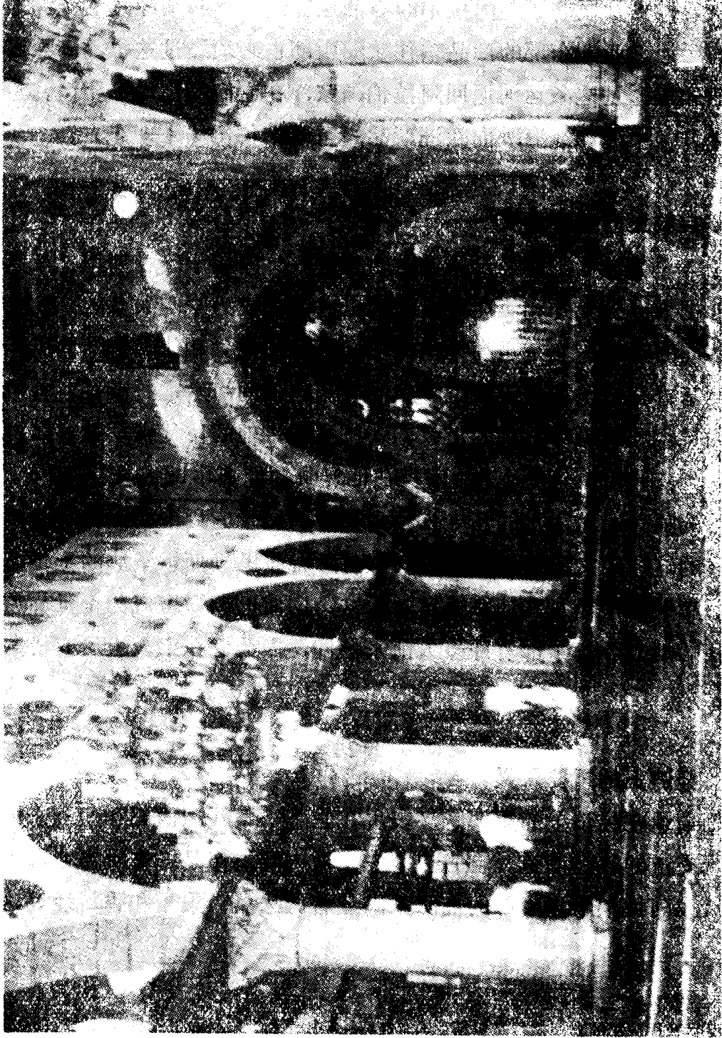
阿克萨清真寺内景