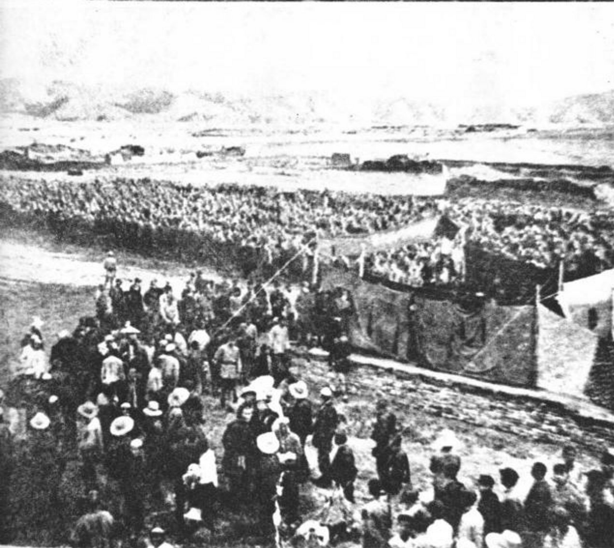
宁夏回民红 军联欢大会