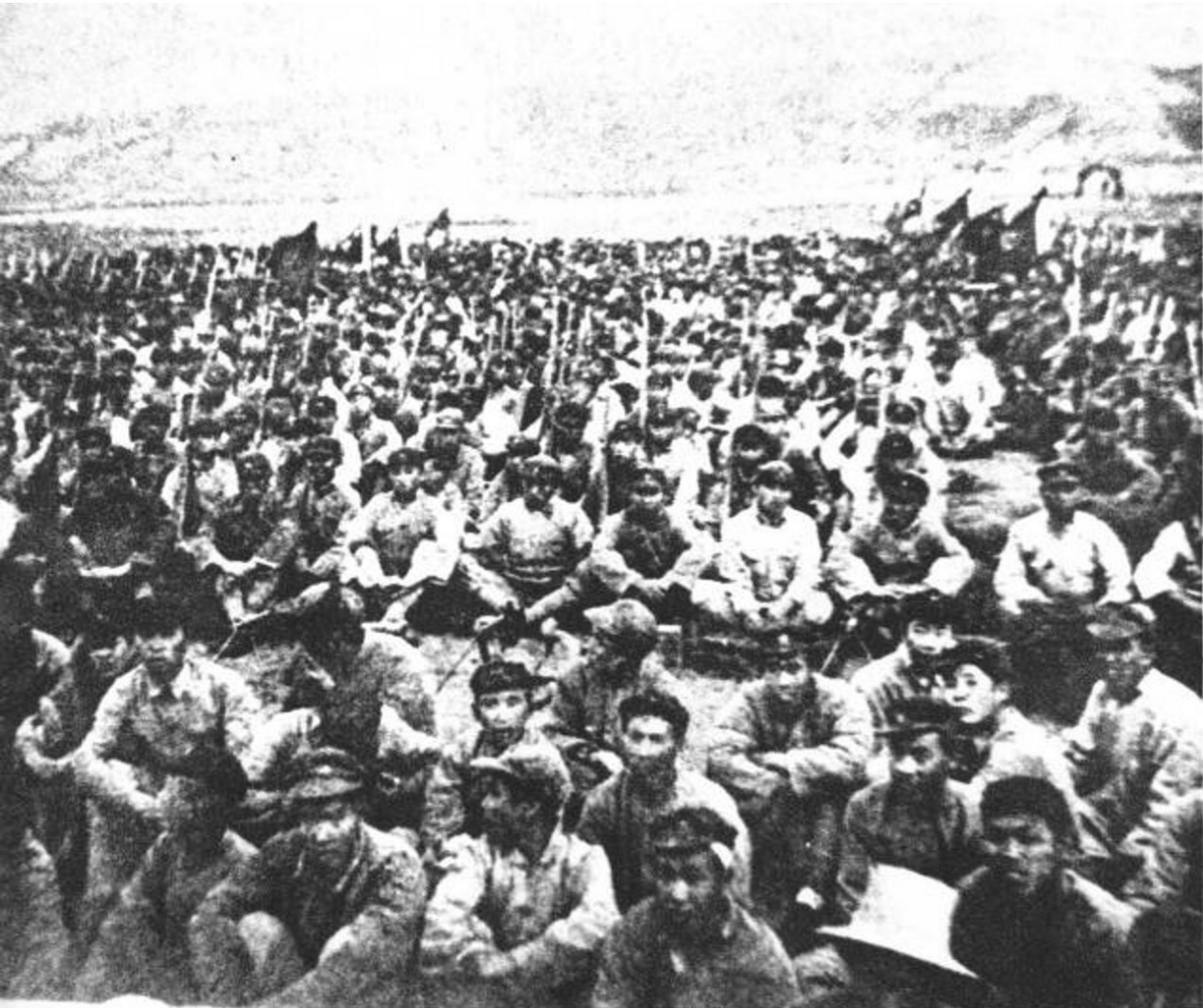
红第一军 团在宁夏