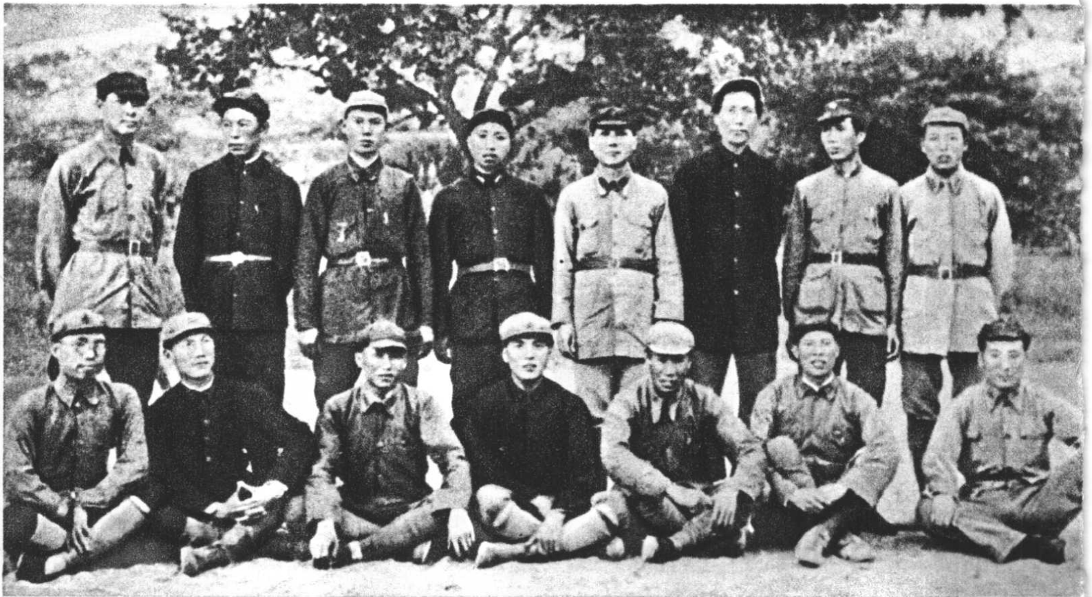
江西井冈山红军创立时的干部