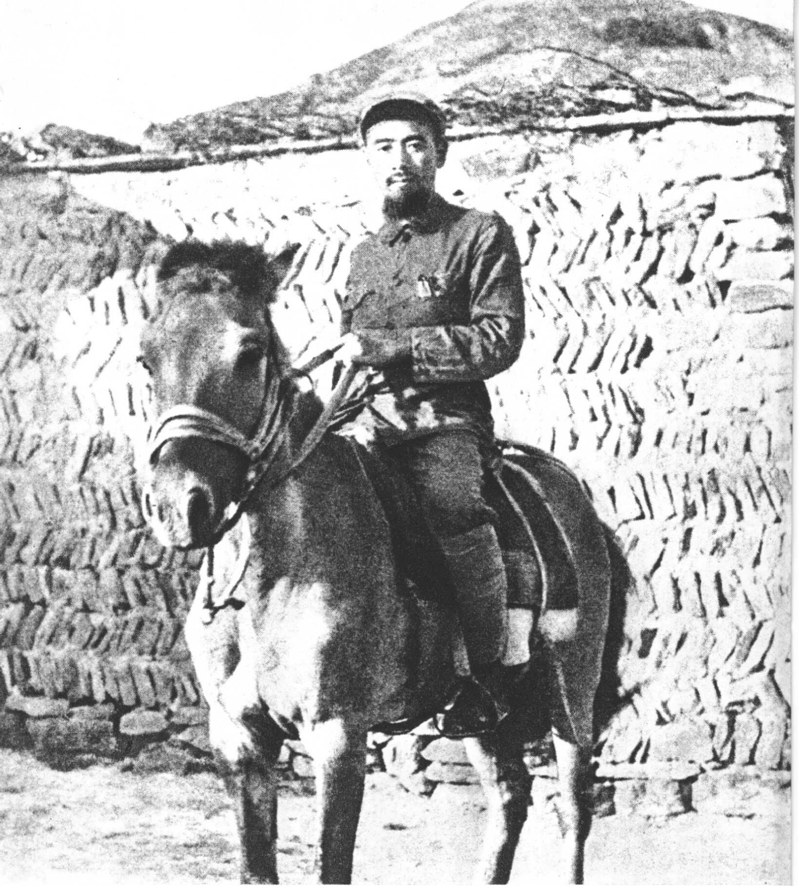
周 恩 来