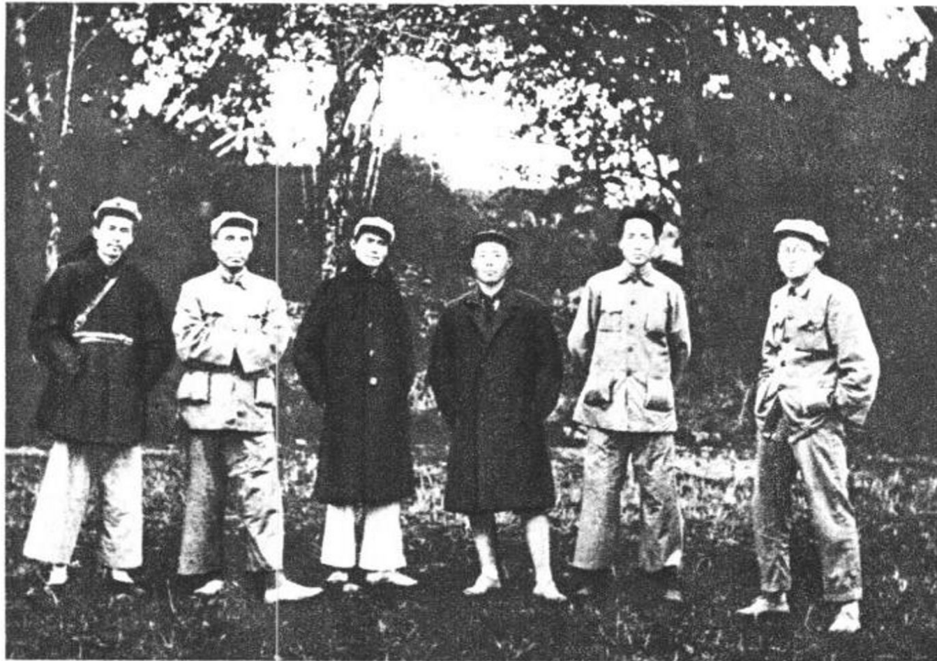
任弼时、朱德、邓发、项英、毛泽东、王稼祥