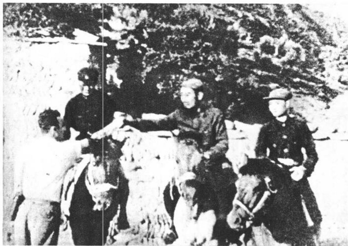
周恩来欢迎斯诺到红区