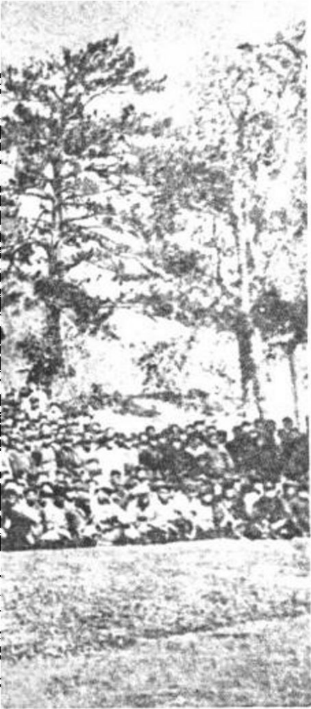
苏维埃第二次代表大会 (一九三四年一月于瑞金)