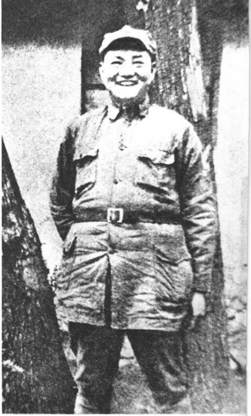
罗 炳 辉