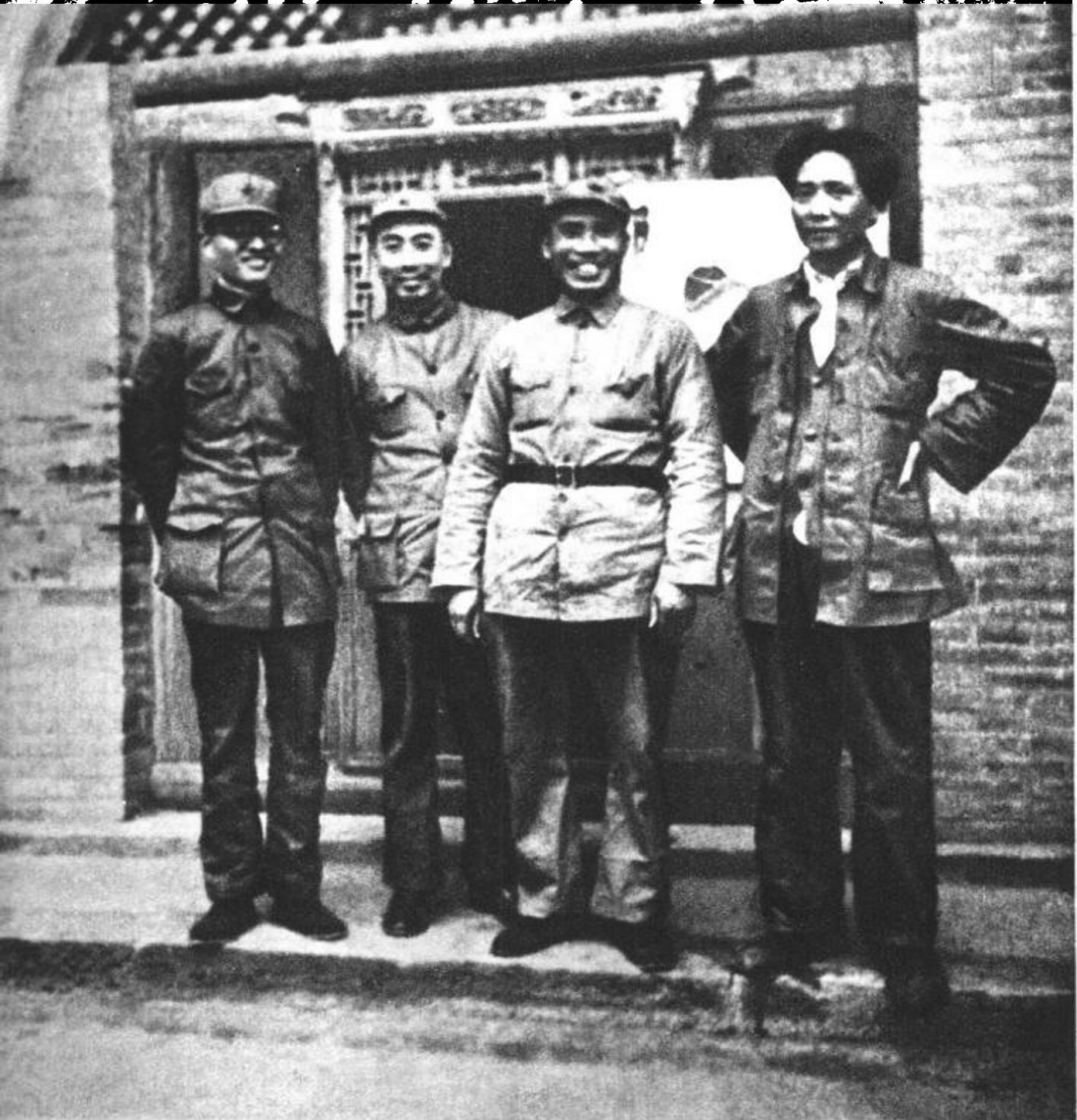
博古、周恩来、朱德、毛泽东