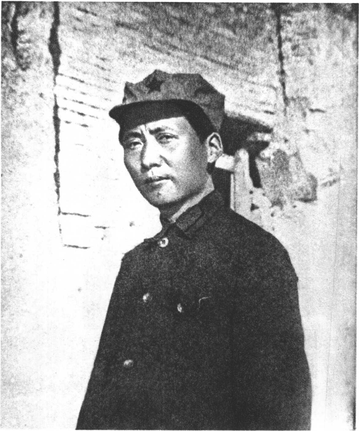
毛 泽 东