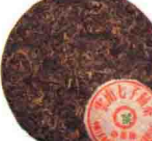
云南七子饼(中茶铁饼) P325