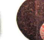
云南七子饼(下关七子饼) P329