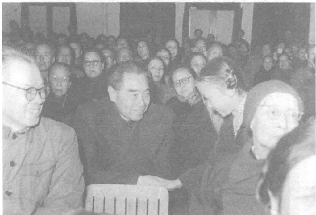
周总理与许宜春聊天（前右老者为周有光先生的母亲）