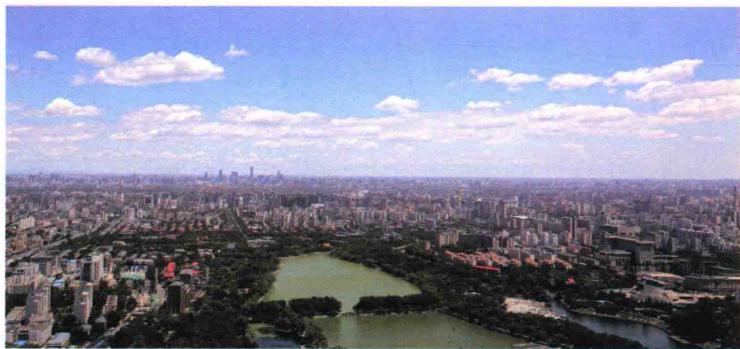
从中央电视台俯瞰北京城

于是，在一次上朝时，皇帝问各位军师们：“我想修一座北京城，在座的谁能帮我去完成这件差事呢？”众军师都低头不语，踌躇不前。这时候，大军师刘伯