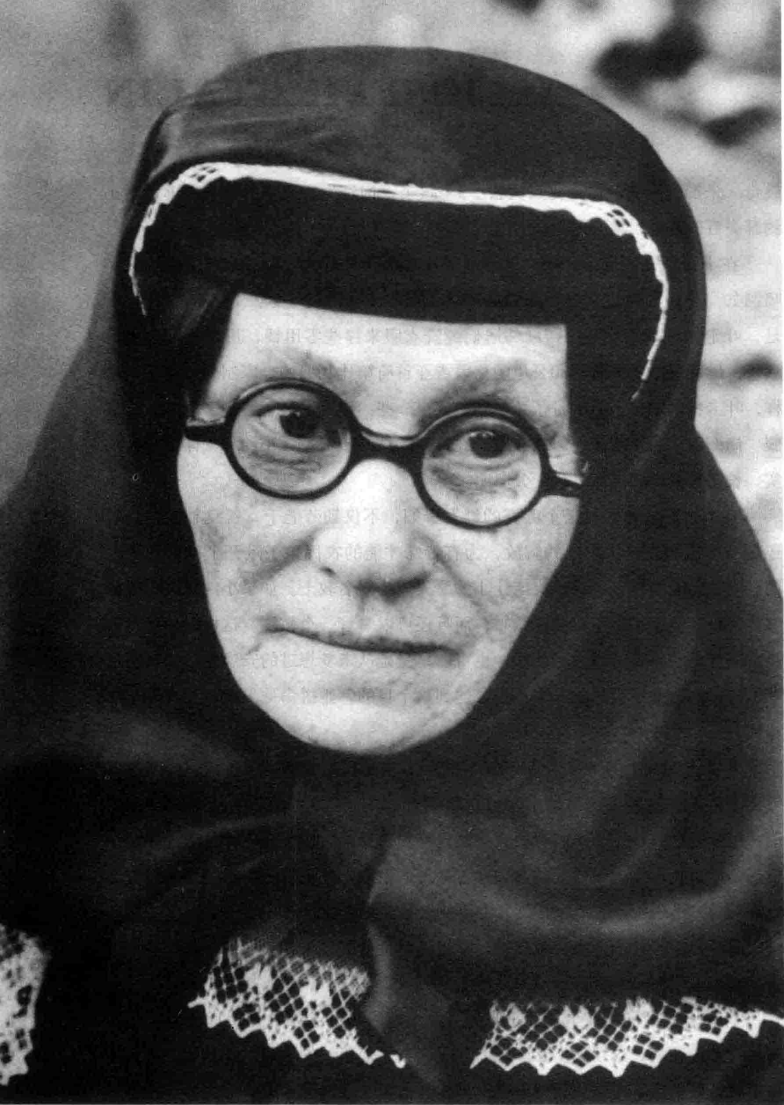
八 斯大林的母亲叶卡特林娜。