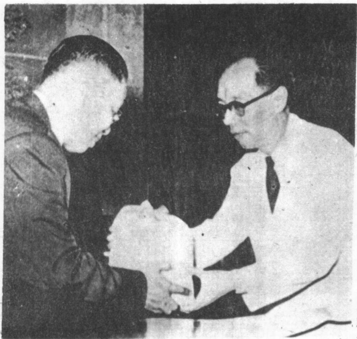
早期財經決策者能超然本地利益團體之上