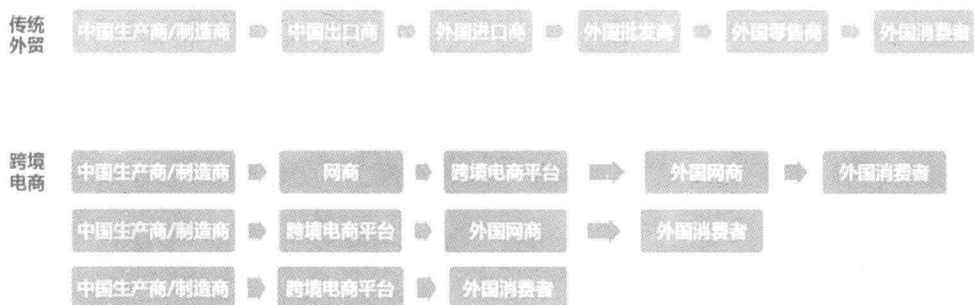
图 1-1 传统贸易与跨境电商商品流通环节对比

(B2C)的直接交易。相对于传统国际贸易的多级分销过程,跨境电商交易过程更直接,减少了贸易环节,节省了时间与资金成本。传统贸易与跨境电商商品流通环节对比如图 1-1 所示。