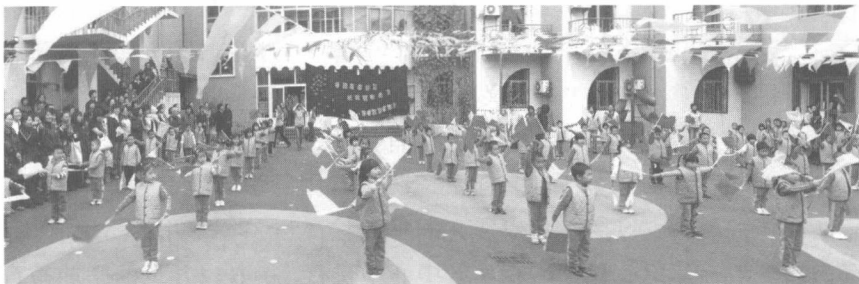
幼儿园里的孩子们

《湖北日报》于2007年3月17日报道了一则题目为《幼教大中专生成了香饽饽》的新闻，称学前教育系的学生每年的就业率都接近100%，去年一度还出现了供不应求的局面；上海、深圳、广州等大城市也均不同程度地出现了上述情况。幼儿师范的毕业生供不应求的现象普遍存在。