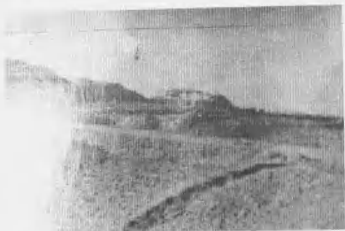
曹起潜烈士牺牲地点(今镇江北固山)