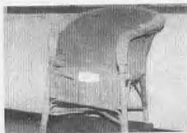
曹起潜烈士遗物(二)