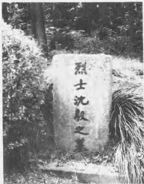
中共泰兴县委书记 沈毅之墓（在今泰州市境内）