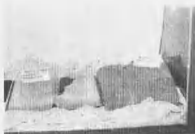
曹起潜烈士遗物(一)