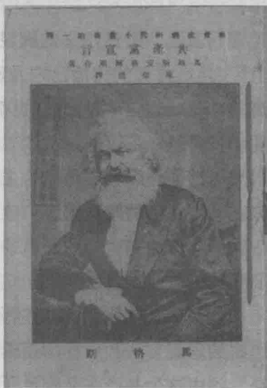
早期的中文版《共产党宣言》

首先给我们的直接感受是，这段话把两大阵营的尖锐斗争昭然揭出，明确地强调了《共产党宣言》的写作背景就是斗争兴起的时代。