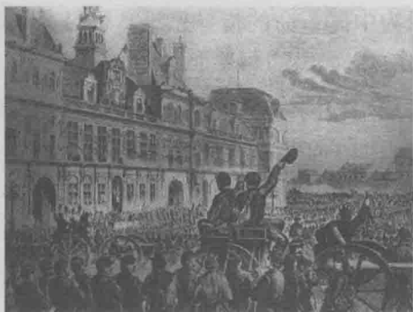
1871年3月28日巴黎公社宣告成立

级力量对比的悬殊，他事先并不赞成巴黎的工人阶级立刻举行武装起义，但是，当工人阶级已经起来斗争时，他无条件地站在了公社战士一边。身在伦敦的马克思通过共产国际组织号召各国工人阶级开展各种声援活动，成了支持巴黎公社的“国际大首领”。