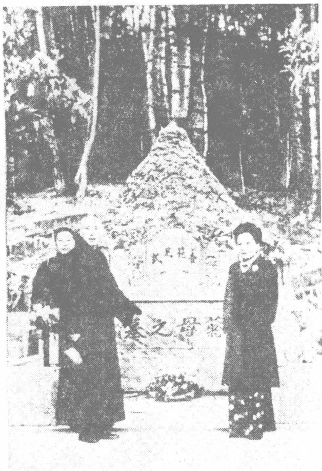
蒋介石偕夫人率长子经国扫墓