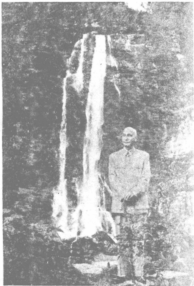
蒋介石影于乌来瀑布旁