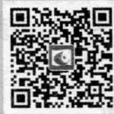
西南师范大学出版社