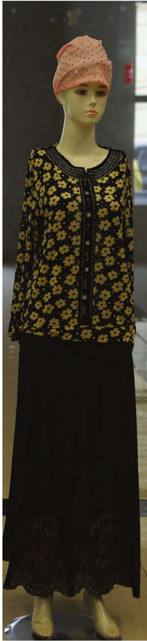
الأزياء الحديثة لقومية هوي