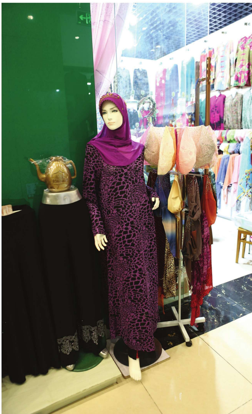
الحجاب والجلاب العربية