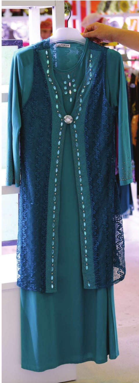
الأزياء الحديثة لقومية هوي