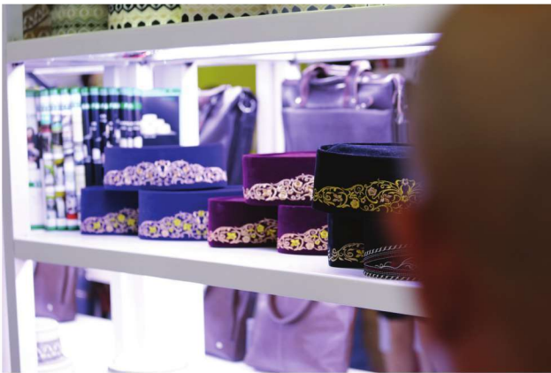
قبة لقومية هوي