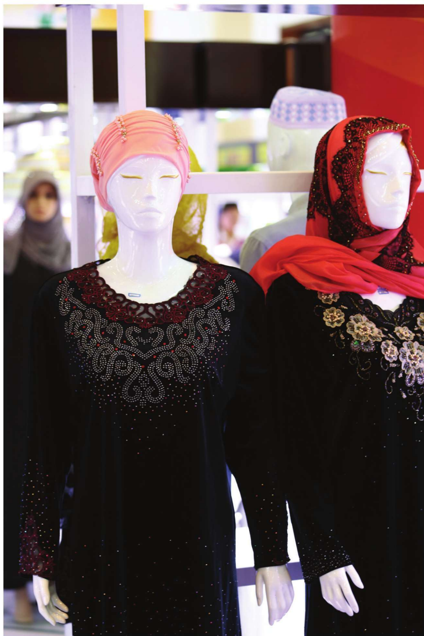
الأزياء الحديثة لقومية هوي