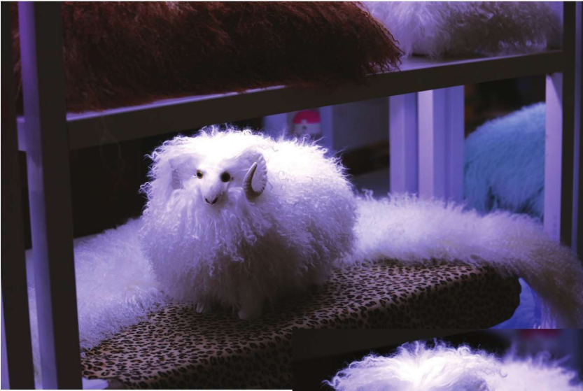
الشال الفروي للنساء