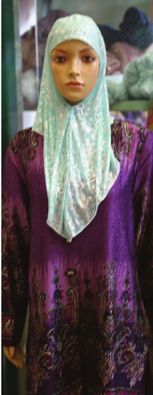
الأزياء الحديثة لقومية هوي