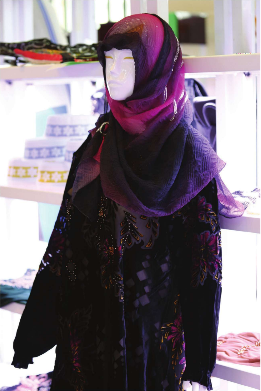
الأزياء الحديثة لقومية هوي