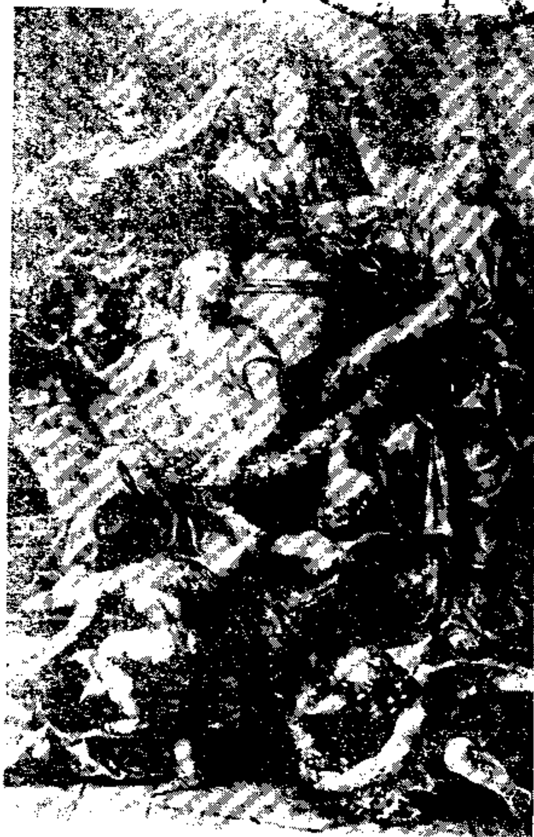
图2 狄德罗主编的法国《百科全书》第一版的卷首画