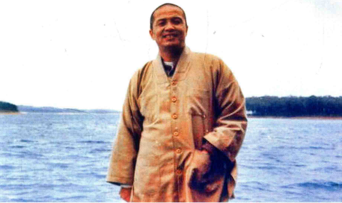
背后是琼州海峡，准备过海传法（1995年）