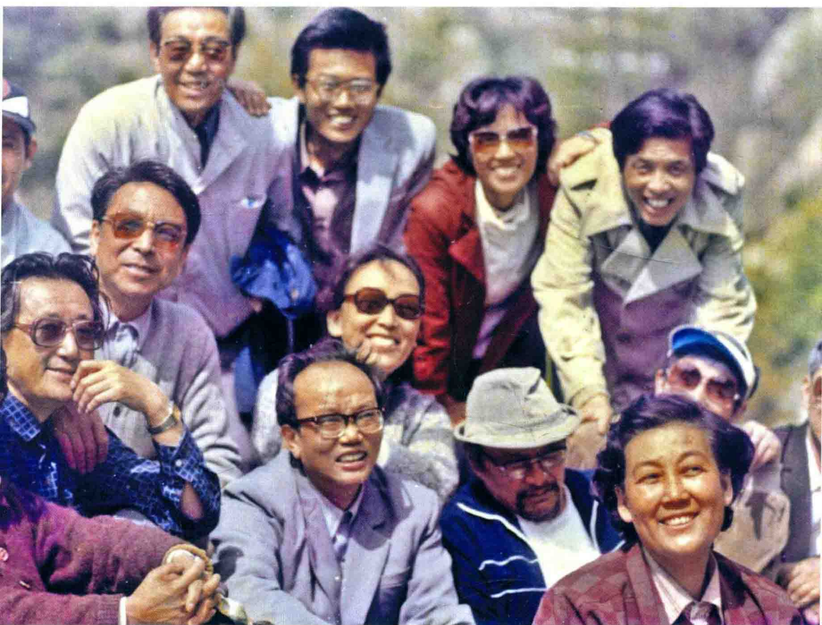
出家前和西安话剧院的演员们合影