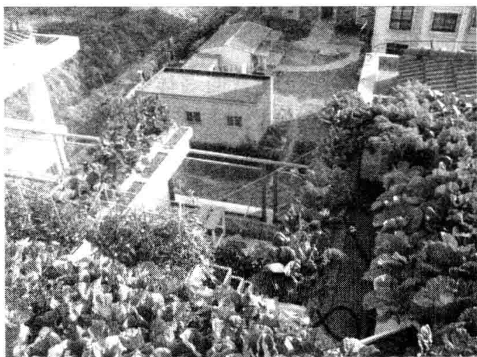
图 1-2 斜坡楼顶（一）

阳台种植国际上的通俗定义是一切脱离了地气的种植技术，它的涵盖面不单单是屋顶种植，还包括露台、天台、阳台、墙体、地下车库顶部、立交桥等一切不与地面、自然、土壤相连接的各类建筑物和构筑物的特殊空间的绿化。它是人们根据建筑屋顶结构特点、荷载和屋顶上的生态环境条件，选择生长习性与之相适应的植物材料，通过一定技艺，在建筑物顶部及一切特殊空间建造绿色景观的一种形式（图 1-1~图 1-4）。