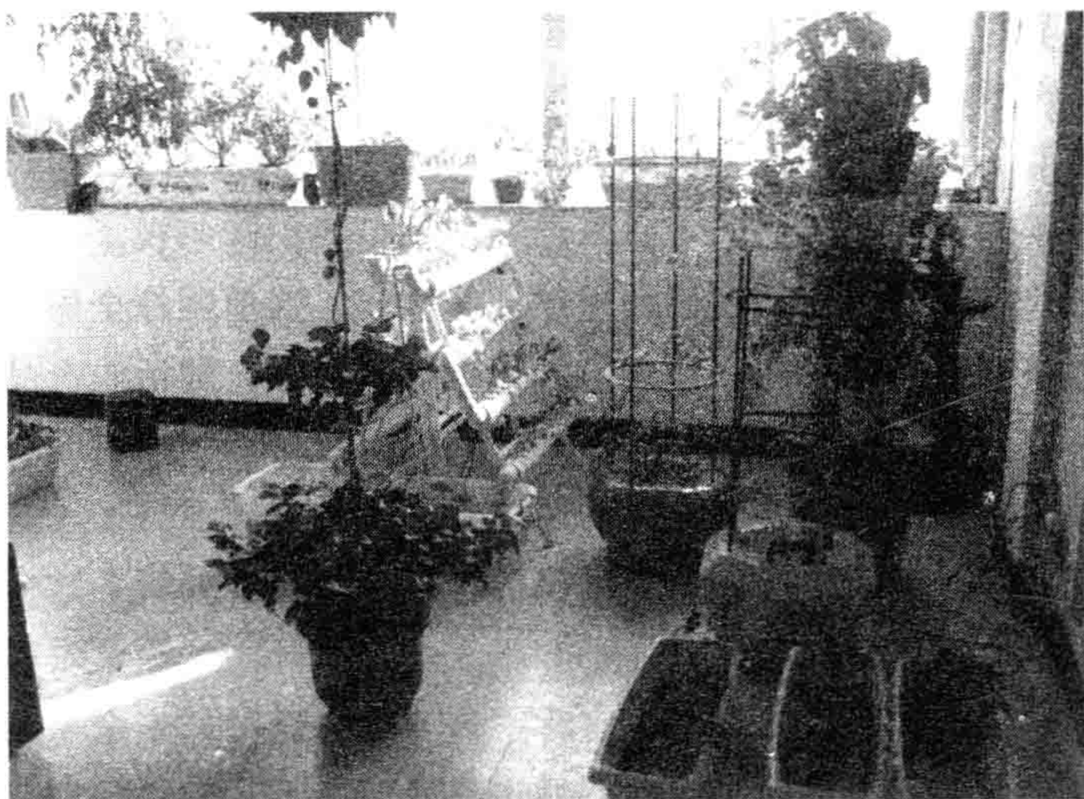
图 1-4 室内阳台