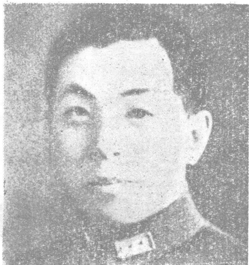
西安事变时 期的张学良