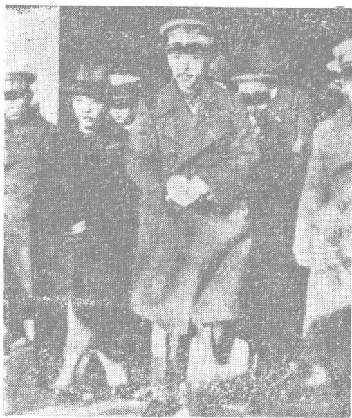
一九三〇年张 学良南下就职海陆 空军副司令时摄于 南京