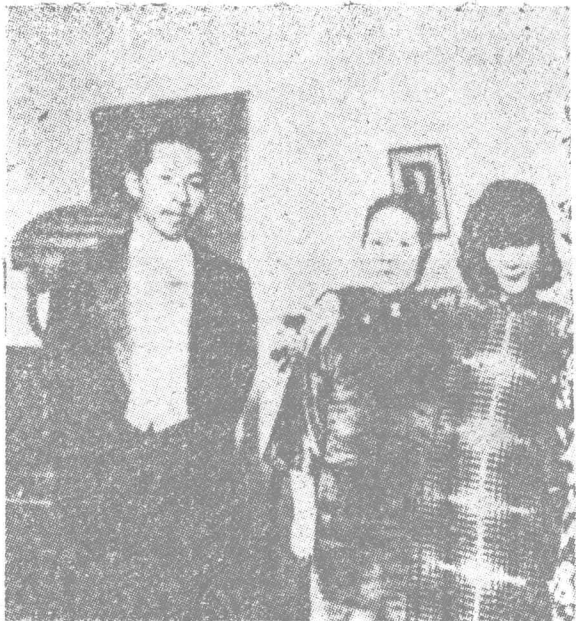
张学良 (左)和宋霭 龄(中)于凤 至的合影