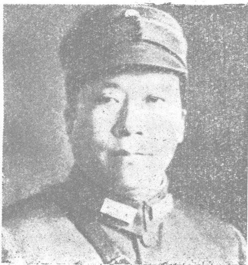
西安事变时 期的杨虎城