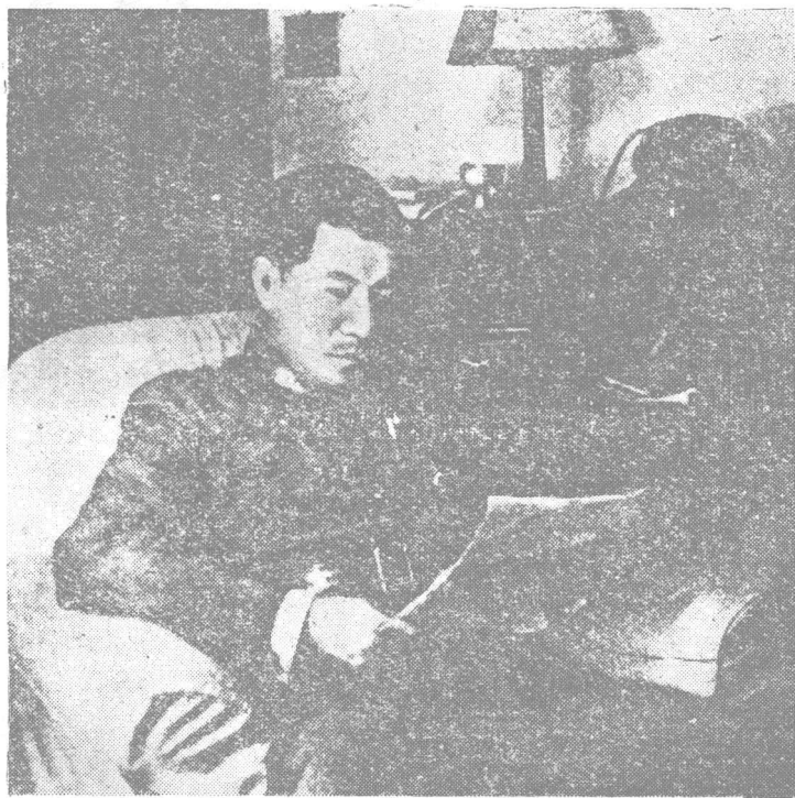
西安事变前的张学良