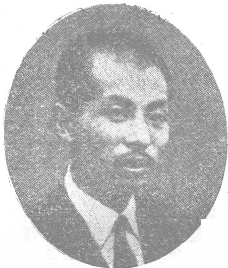
张 学 良