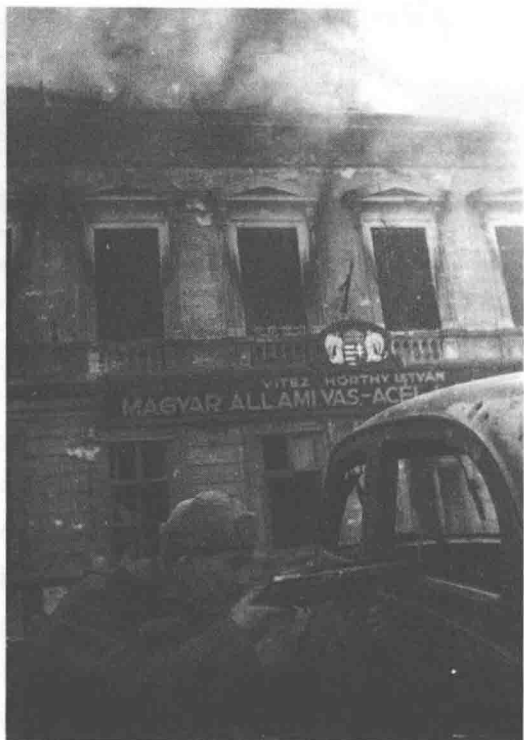
布达佩斯巷战中，躲在一辆汽车后射击的苏联士兵

莫斯科的正式训令于10月28日晚22时下达，16个小时后，即1944年10月29日14时，马利诺夫斯基就开始进攻了。苏联第46集团军（第37、10、31、23军）向匈军6个师发动猛攻。这股匈军实力并不弱，根据南方集团军群报告，共有13300名“战斗力量”（主要指步兵，推算其总兵力大概有4万人），配备了29辆战车和98门野战炮。而且和俄国人所期待的不同，匈牙利人打得相当顽强。但苏军实力更强，投入兵力约7万~8万人，相当于匈军一倍，炮兵力量更是压倒性优势。经过一番激战，匈军防线果然如纸房子般瞬间坍塌。这天