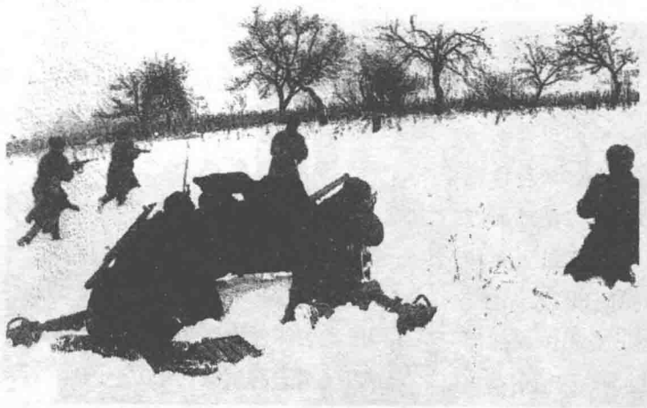
在布达佩斯西南作战的苏军，1945年2月

旅有6个满编营 35 ，实力超过很多野战师。可是，过去他们对付游击队和造反的平民虽然还算凑合，现在却很快被证明完全不适合野战，在苏军冲击下不是成群结队地逃跑就是叛变，还有些人趁乱打死了自己的上司。12月14日，伊波利萨哥落入苏军之手。