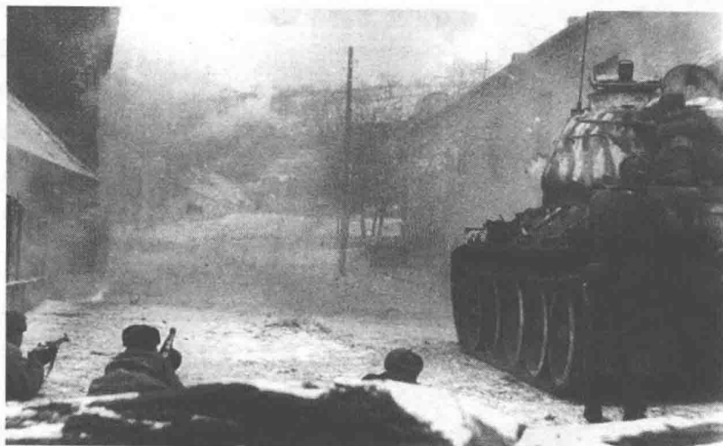
布达佩斯巷战，在T-34 85型坦克配合下的苏联步兵小组 1945年1月

苏联总参谋部焦虑地关注着布达佩斯城下的激战，他们逐渐意识到，只打开一条狭窄通道的苏军先头部队势单力薄（2个机械化军和少量步兵），正面受阻于顽强抵抗的布达佩斯城郊守军，侧翼还受到德军装甲部队的严重威胁。加上苏军未能切断布达佩斯的交通线，德军还将派来更多的增援部队。再这样打下去要吃大亏。11月4日，苏联大本营要求马利诺夫斯基尽快让中路和右翼（第27、40、53集团军，近卫第7集团军）进至蒂萨河西岸，从北面和东北面发起一场声势浩大的全线攻击，以策应在布达佩斯南郊苦战的第46集团军。普