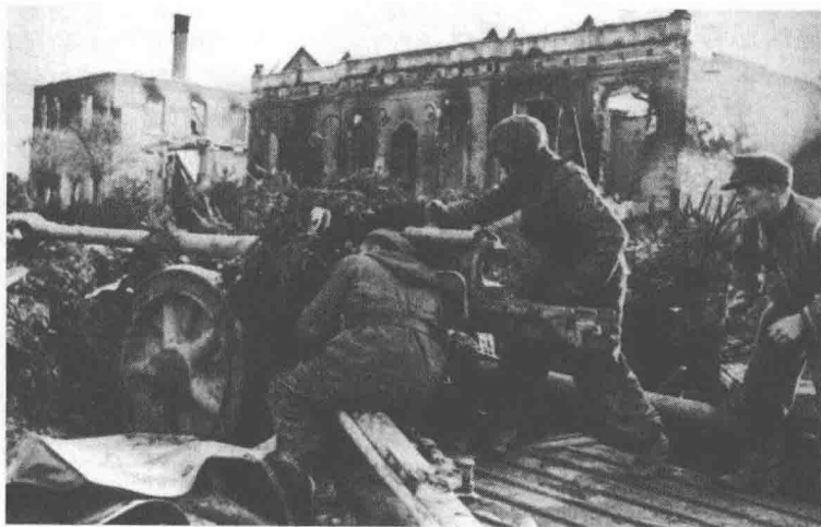
防守在布达佩斯城内的德国党卫军75毫米重型反坦克炮小组

托尔布欣的主张得到了莫斯科的认可。苏联大本营在12月12日发布训令，决定由乌克兰第2、3方面军共同包围并攻下布达佩斯。同时决定把多瑙河西岸的第46集团军交给托尔布欣。根据这一训令，托尔布欣于12月15日，马利诺夫斯基于12月