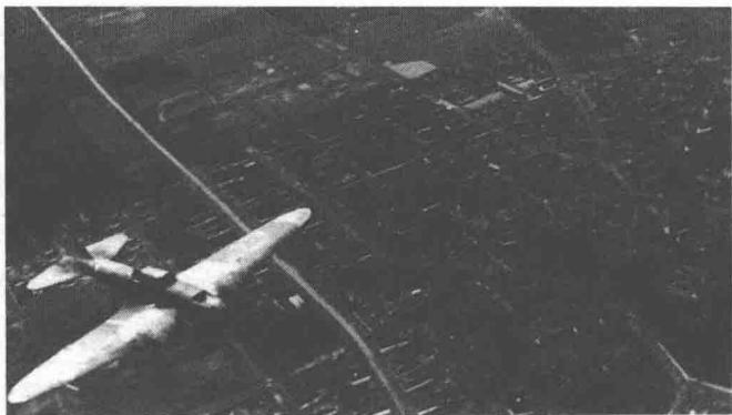
1架苏军的伊尔-2掠过布达佩斯上空

马利诺夫斯基的对手——弗里斯纳大将的德国南方集团军群，放弃德布勒森后，正退守在蒂萨河地区。北段展开了第8集团军，中段为第6集团军，南翼是匈牙利第3集团军。他们刚刚占领的新防线极为脆