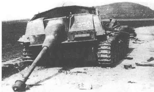
1辆打散了架的三号强击火炮

下午，第46集团军在凯奇凯梅特附近撕开了匈牙利第8军的阵地 ③ ，前进了4~6公里。随后投入的近卫第2机械化军（248辆战车）一路向北高速推进50公里，绕到仍留在蒂萨河畔的德国第6集团军后方。