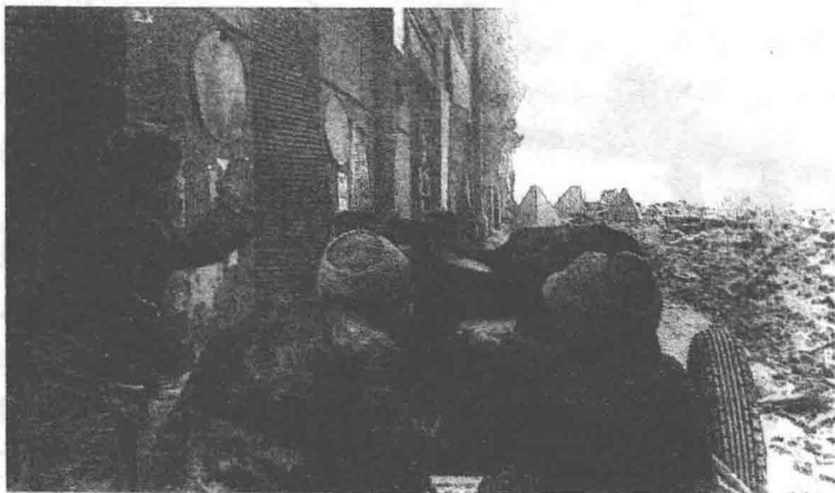
布达战斗中苏联火炮小组，1945年2月