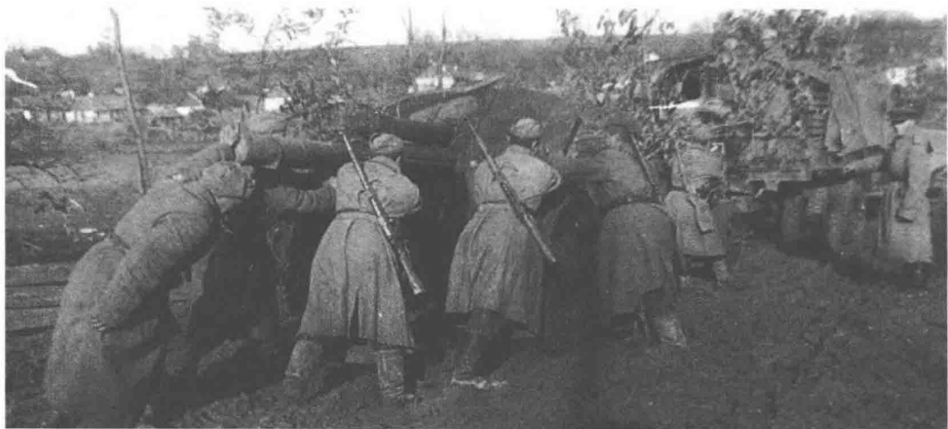
在泥泞道路上推动一门122榴弹炮的苏联士兵，匈牙利战场，1945年3月

在，他本人，以及苏军总参谋部，却主张乌克兰第3方面军也应该参加布达佩斯之战。但前提是，托尔布欣首先要穿过河水泛滥的匈牙利南部，这需要耗费不少时间。