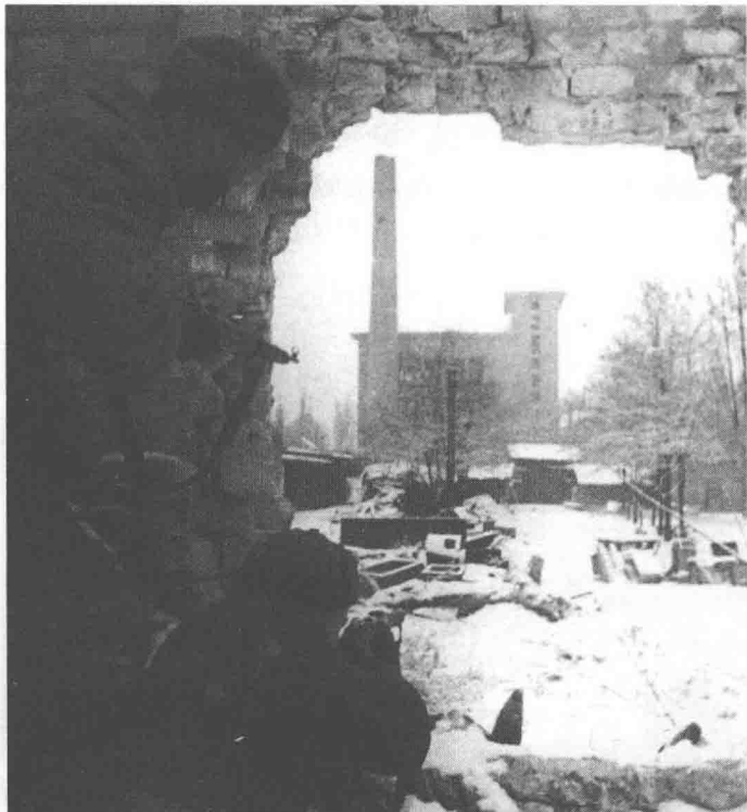
布达巷战中，通过墙壁缺口射击的苏联步兵

红军的新攻势于11月11日发动。在布达佩斯以东和东北，苏军全力攻打了德军第8集团军和第6集团军的左翼，沿着泥泞的道路以每昼