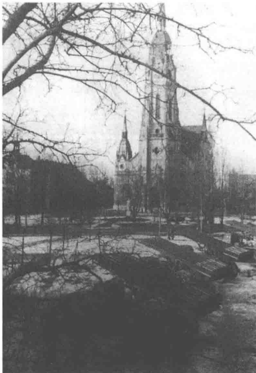
参加布达佩斯巷战的苏军火箭炮队