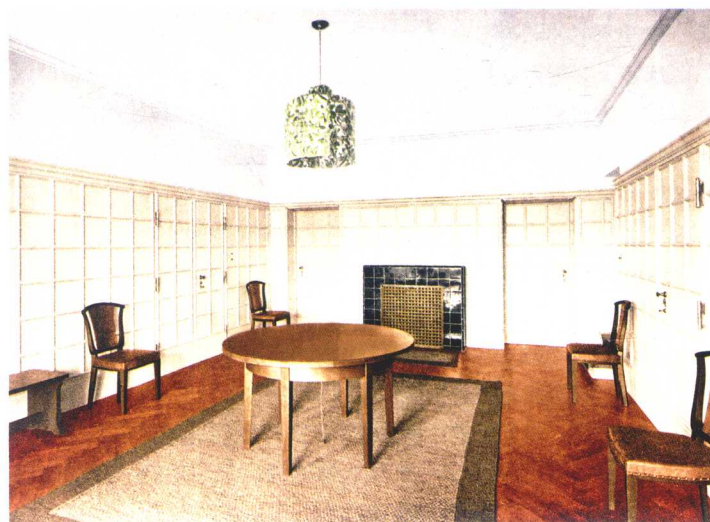
路德维希·密斯·凡·德·罗， 里尔住宅，新巴伯斯贝格，1908年