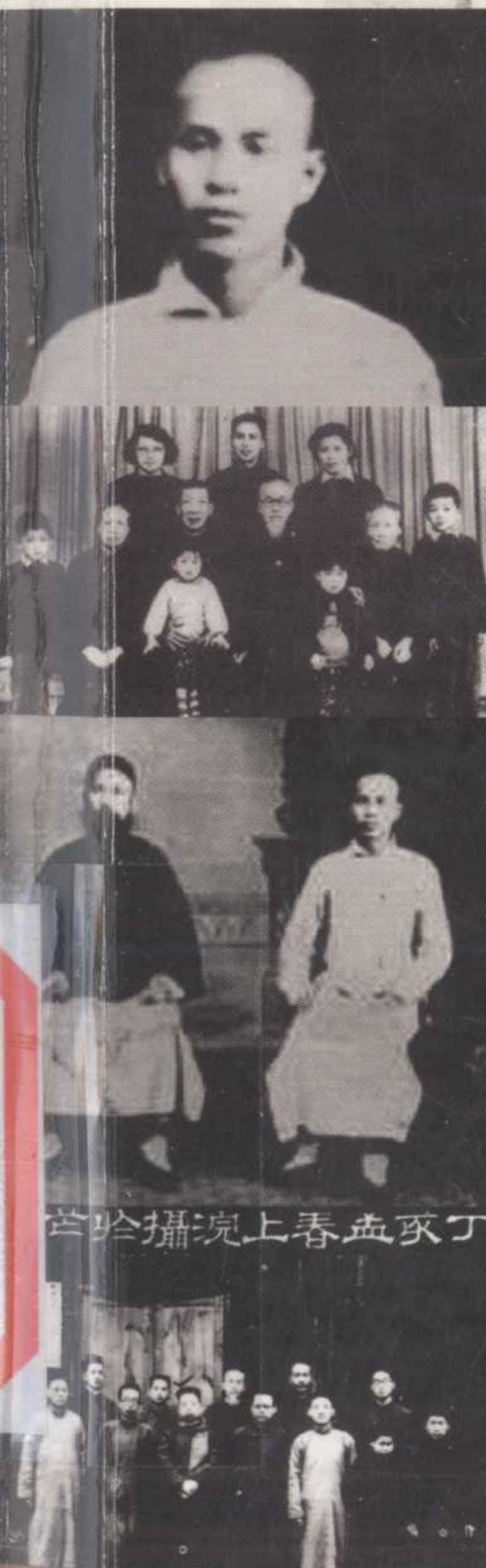
丁亥孟春上浣拍摄