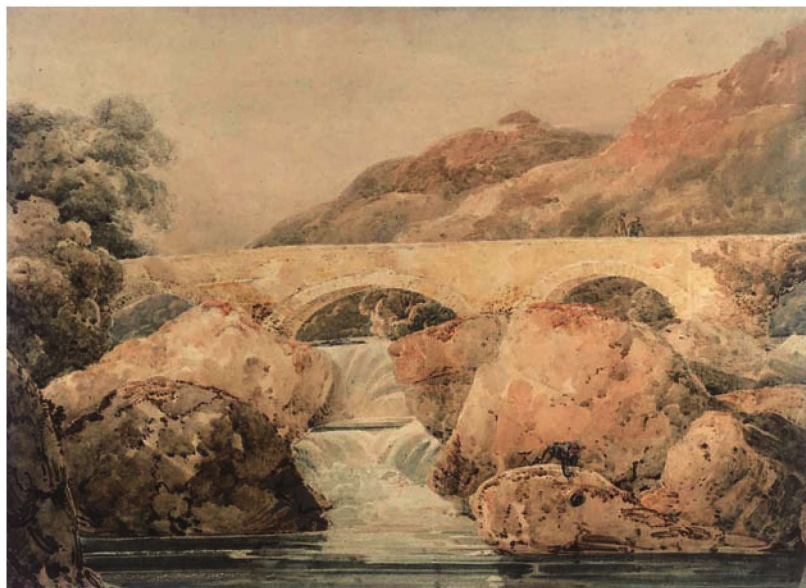
图 1-10 《庞蒂佩尔》 托马斯·格尔丁

托马斯·格尔丁(Thomas Girtin, 1775—1802)虽生命短暂,但成就卓著。他将水彩画从早期较单纯的淡彩画法,发展成为充分运用色彩并具有丰富色调的画种,对透纳及以后的画家都产生了影响。在水彩画技法上,他将传统的先打灰色底再上色的画法,转变为用暖色或关系色打底,强化了景物整体色彩氛围,使画面呈现出柔和的黄色、褐色、紫色等色彩效果。巧妙地用光来表现明暗反差,突出画面的明暗对比,打破了英国早期水彩画的单调与刻板,给人以明快、亲切、自然的感受。(图 1-10)