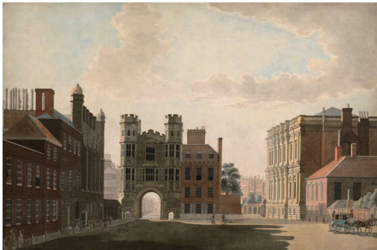
图 1-6 《白厅街的霍尔拜恩门和宴会厅》 托马斯·桑德比