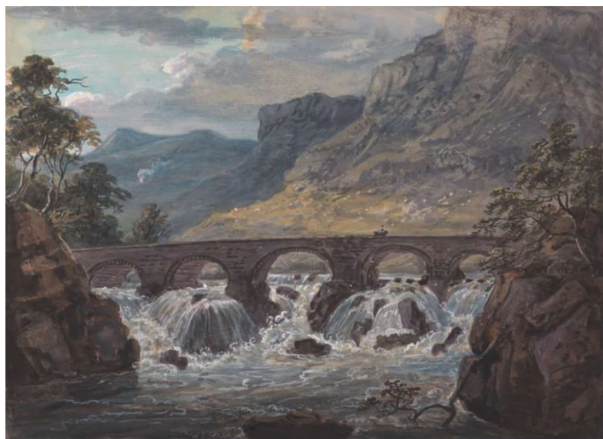
图 1-5 《庞蒂码头》 保罗·桑德比

画并创作了许多优秀水彩画风景、人物画作品的画家,在英国水彩画发展史上具有重要地位。他总结了大量的水彩画创作经验,建立了一套体系化的水彩画技法与评判标准,在探索材料语言与表现方面有突破性的建树。他将水粉颜料挪用于水彩画创作中,使色彩更明亮厚重,造型更浑厚饱满,画面整体更坚实肯定;他在颜料里加入甘油,使其兼具湿润和通透的双重特性,让水彩画的技法与表现变得更为轻松自如。(图 1-5)