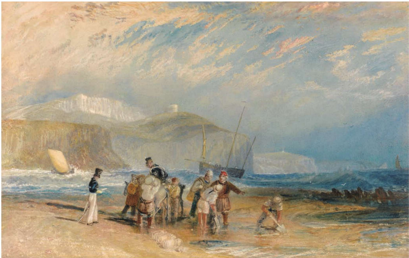
图 1-15 《福克斯通港和多佛海岸》 威廉·透纳

假的程式化绘画，曾说：“世界是广阔的，没有两天是一样的，甚至两个小时也不一样……真正的艺术品，就像那些自然作品一样，彼此是不同的。”他用朴实的手法创作了许多水色淋漓、自然生动、感人至深的水彩画作品。其作品真实、生动地表现了瞬息万变的大自然景色，与当时学院派的虚假、呆板形成鲜明对比，也因此遭到排挤与批评。康斯太勃尔的作品在法国却受到了欢迎，并影响了巴比松画派和后来的印象派画家。他生前没有以水彩画家的身份受到关注，直到 20 世纪才为世人所公认。（图 1-16）