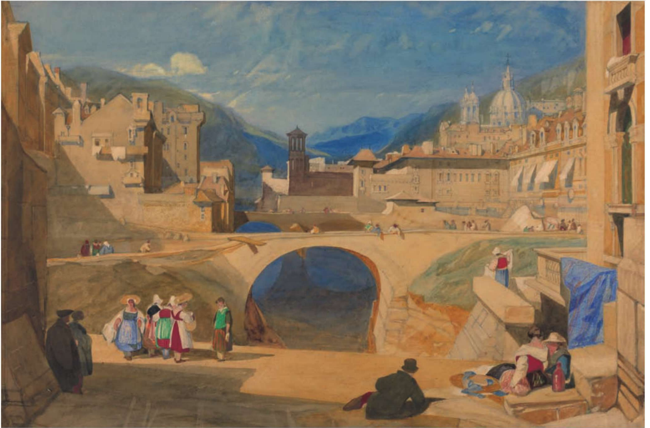
图 1-11 《大陆镇的大桥》 约翰·赛尔·科特曼

约翰·瓦利(John Varley, 1778—1842)是英国的水彩画家、美术教育家,著名画家大卫·考克斯和威廉·透纳都是他的学生。瓦利的水彩风景画常以视域宽广的构图呈现自然风光,这种广角视野延伸拓展了画面的空间,使观者感受到自然景观的宏大,有浩然开阔之感。(图 1-12)