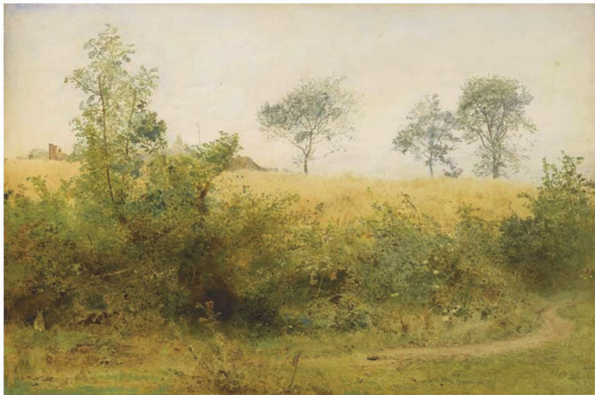
图 1-17 《篱笆墙外的麦田》 约翰·威廉·诺斯

约翰·威廉·诺斯(John William North, 1842—1924)是英国风景画家和插图画家,当时的人们称他为“田园诗人”,他的作品洋溢着温馨而恬静的生活气息。他不借助不透明水彩颜料,仅用普通水彩颜料以纯净的色彩、密集的小点,谨慎、细心地叠加,画出了许多精美、细腻的水彩画作品。这种用透明色块和小笔触的作画方式,丰富了水彩画技法,拓展了水彩画的表现力。(图 1-17)