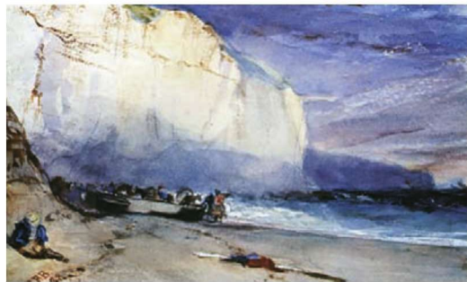
图1-13 《岩下》 理查德·帕克斯·波宁顿

理查德·帕克斯·波宁顿(Richard Parkes Bonington,1802—1828)仅活了26岁,但成就甚高。德拉克洛瓦对他的画曾这样赞誉:“运用水彩的精到巧妙,令人称绝。”他对水彩画技巧大胆革新并获得卓越成效,其绘画手法与中国写意画类似,格调清新,极富韵味。(图1-13)