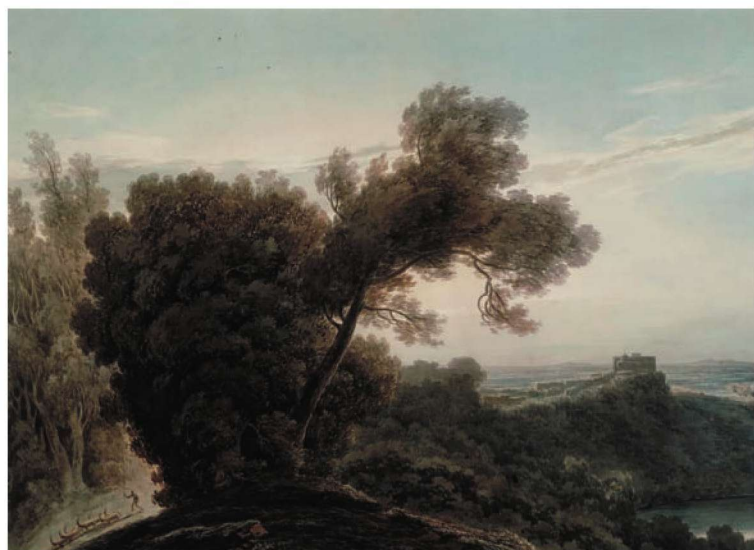
图 1-8 《阿尔巴诺湖和甘道夫城堡》 约翰·罗伯特·科仁斯

约翰·罗伯特·科仁斯(John Robert Cozens,1752—1797)是英国水彩画发展中的“桥梁”人物。他继承了前辈的表现技法,梳理了水彩技法理论并不断实践突破,把早期用于记录的地形画水彩推向吟咏诗意的自然风景水彩,在技法上摒弃了勾线平涂的传统技法,摆脱了水彩画对钢笔图稿的依附,创造了水彩画的“泼色法”(该方法与中国画的“泼墨法”有相通之处)。其作品的特点是把轮廓线隐藏在颜色里,画面中的一切由色彩构成,用色不多,强调光影明暗对比。他善于描写、表现透射的阳光,画面极富诗意。(图 1-8)