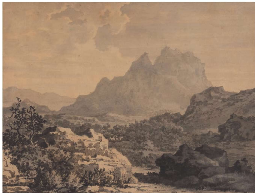
图 1-4 《群山风景》 亚历山大·科仁斯

保罗·桑德比(Paul Sandby, 1725—1809),英国地形画绘图员,是 28 位英国“皇家美术学院”的筹建者之一,被誉为“英国水彩之父”。他在水彩技法上做了许多尝试,他极力挣脱地形画的束缚,是最早把地形画转入风景