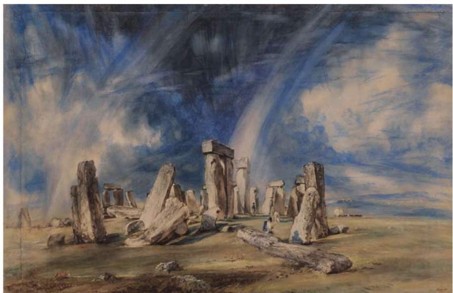
图 1-16 《巨石阵》 约翰·康斯太勃尔

假的程式化绘画，曾说：“世界是广阔的，没有两天是一样的，甚至两个小时也不一样……真正的艺术品，就像那些自然作品一样，彼此是不同的。”他用朴实的手法创作了许多水色淋漓、自然生动、感人至深的水彩画作品。其作品真实、生动地表现了瞬息万变的大自然景色，与当时学院派的虚假、呆板形成鲜明对比，也因此遭到排挤与批评。康斯太勃尔的作品在法国却受到了欢迎，并影响了巴比松画派和后来的印象派画家。他生前没有以水彩画家的身份受到关注，直到 20 世纪才为世人所公认。（图 1-16）