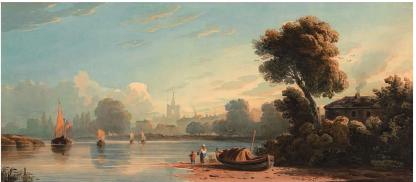
图 1-12 《奇西克》 约翰·瓦利

约翰·瓦利(John Varley, 1778—1842)是英国的水彩画家、美术教育家,著名画家大卫·考克斯和威廉·透纳都是他的学生。瓦利的水彩风景画常以视域宽广的构图呈现自然风光,这种广角视野延伸拓展了画面的空间,使观者感受到自然景观的宏大,有浩然开阔之感。(图 1-12)