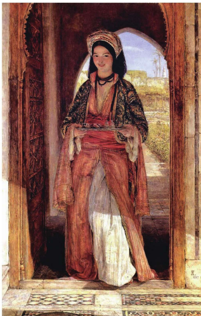
图 1-18 《端咖啡的人》 约翰·弗雷德里克·刘易斯

约翰·弗雷德里克·刘易斯(John Frederick Lewis, 1805—1876)出生于英国伦敦。他的作品用笔精巧细致,细节刻画工整细腻,画面总体效果浑厚,光照明暗巧妙,色彩明丽和谐。刘易斯最初是动物画家并在温莎公园画场景图,后来游历中东,被那里充满神秘的异域风情所吸引,创作了大量描绘东方风土人情的作品。刘易斯不仅擅画水彩,也进行油画创作,并将油画的技法引入水彩画中,两者交融,引人入胜。(图 1-18)