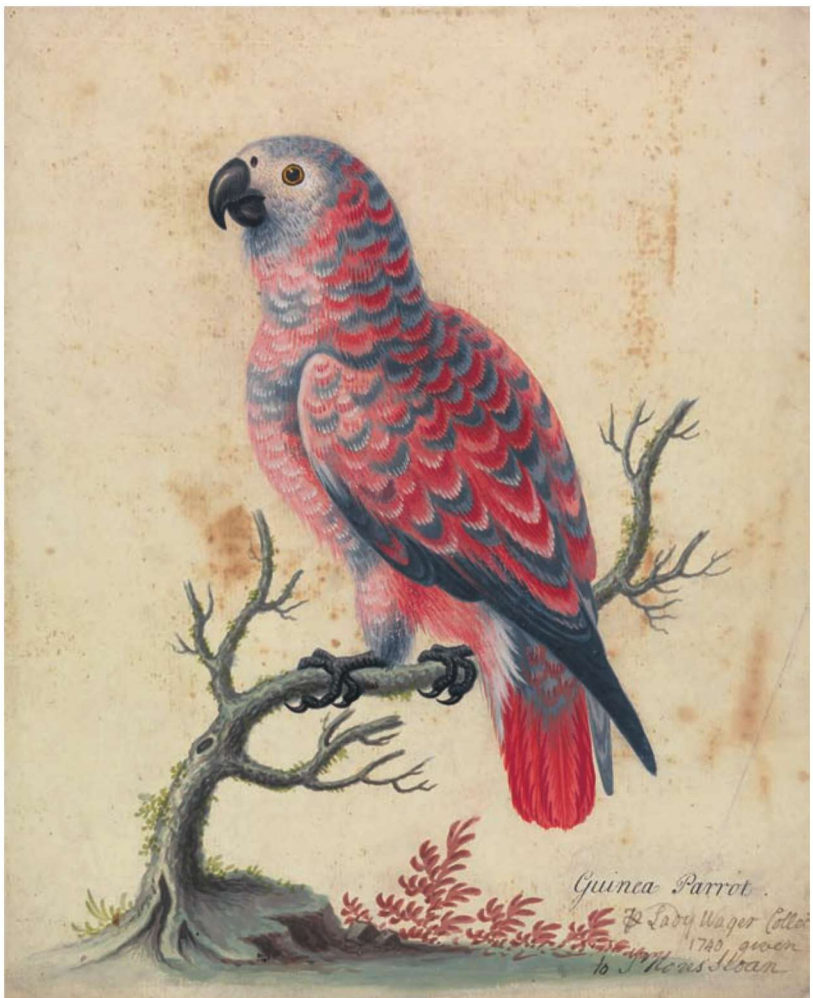
图 1-3 《几内亚鹦鹉》 乔治·爱德华兹