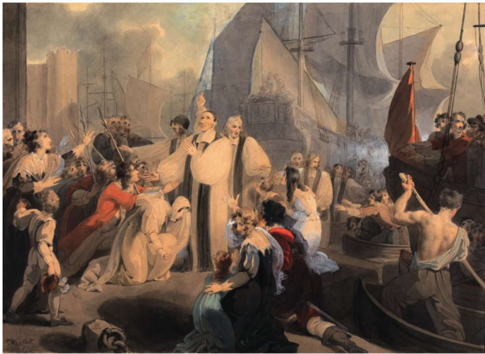
图1-14 《七主教受审》 理查德·韦斯托尔

理查德·韦斯托尔(Richard Westall,1765—1836),英国画家,因绘制肖像和历史、文学事件而闻名,曾担任过维多利亚女王的专属画师。有人赞誉他“用画笔打败了诗歌”。(图1-14)