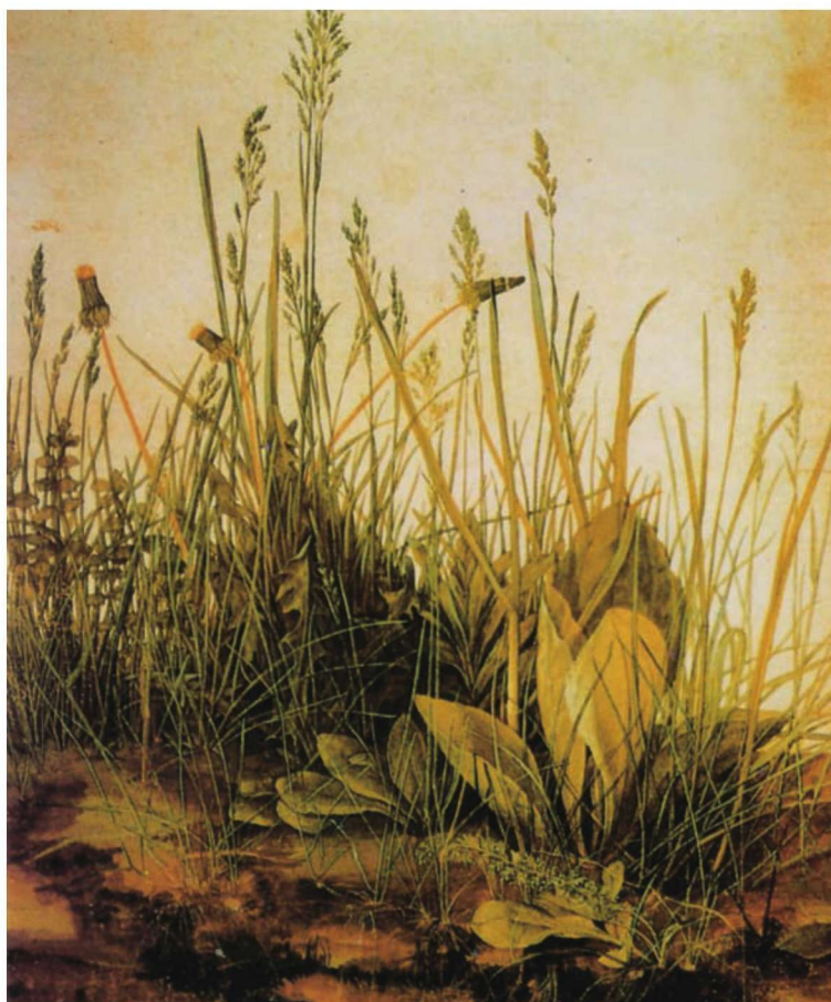
图 1-1 《草地一角》阿尔布雷希特·丢勒

乔治·爱德华兹(Georges Edwards, 1694—1773)是英国自然学家和鸟类学家,被称为“英国鸟类学之父”。他游历欧洲学习自然历史,因绘制动物尤其是鸟类的彩色图画而闻名于当时的画坛。他将鸟与植物搭配构图,画面简洁而有装饰意味。鸟的神情、