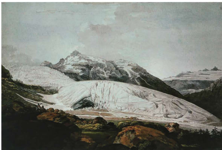
图 1-7 《罗纳河冰川》 威廉·帕尔斯

威廉·帕尔斯(William Paris,1742—1782)是英国肖像、风景画家,亦是绘图员,擅长水彩画创作。(图 1-7)