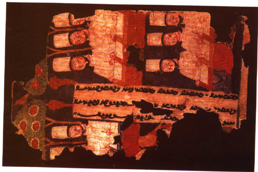
吐鲁番发现的回鹘文摩尼教文献插图