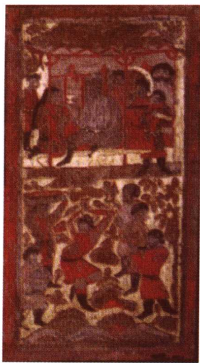
北周安迦墓出土石榻 后屏乐舞图二