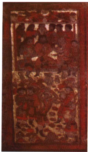
北周安迦墓出土石榻 后屏乐舞图一