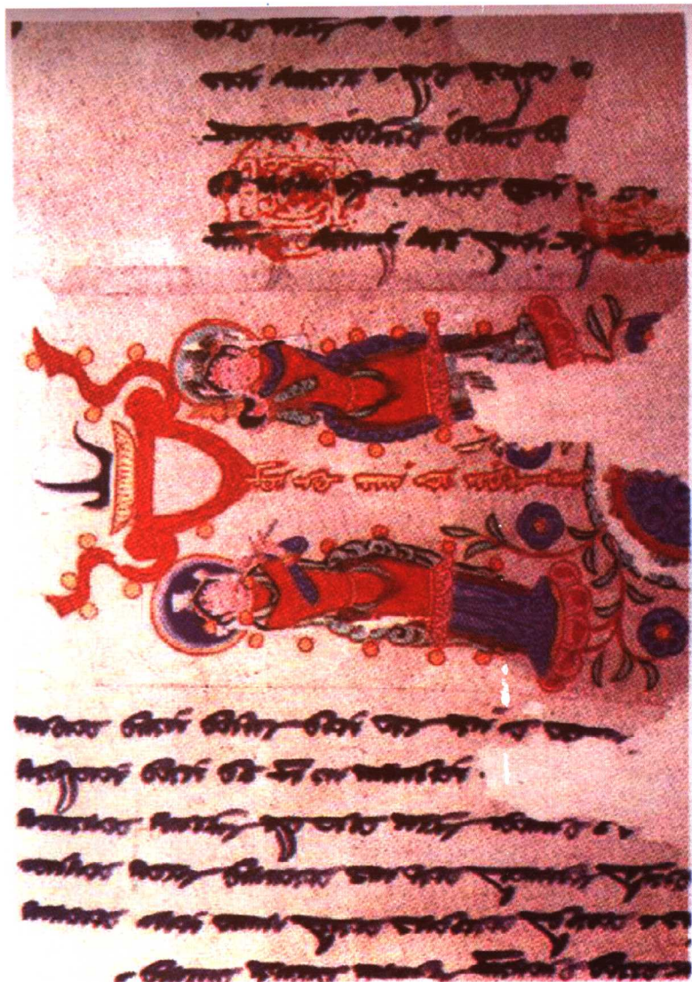
新疆柯孜克里克出土的粟特文摩尼教文献