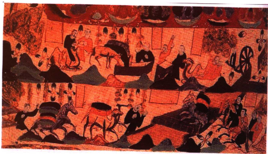
敦煌壁画商旅图(上图为商队到达驿站,下图为胡汉商队在途中相遇)