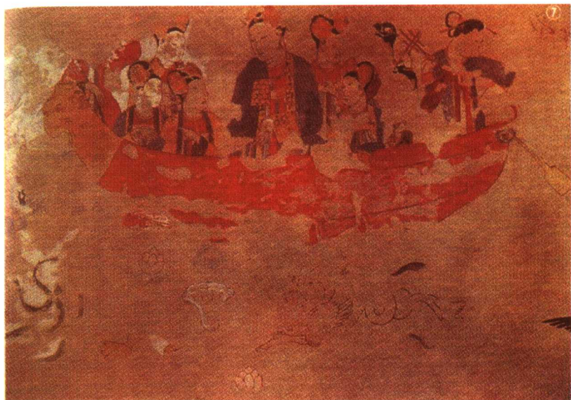
康国故地发现的唐代风格壁画(唐装仕女泛舟图)