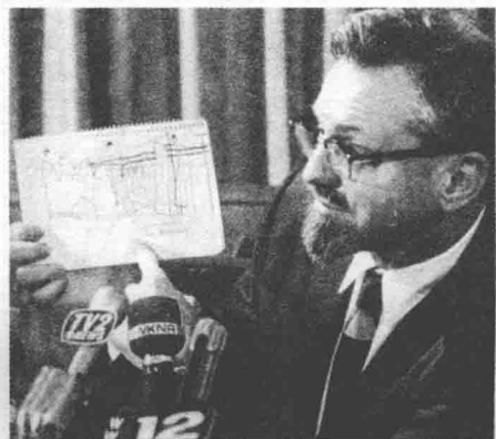
美国顾问海奈克展示 UFO 草图

在 1966 年 3 月的一次记者招待会上，美国空军蓝皮书作业组织的顾问海奈克展示一幅密歇根 UFO 目击者所绘的草图。美国政府自此开始调查 UFO 事件。