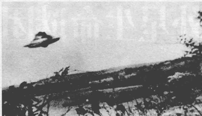
这张拥有经典外观的 UFO 照片拍摄于 1967 年美国罗得州。

较量中都以人类的失败而结束。1956 年 10 月 8 日，一个 UFO 出现在日本冲绳岛附近，适逢附近正在实弹演习的一架西方盟国的战斗机飞过，机警的战斗机炮手马上向它开炮。结果炮弹爆炸后，“先下手为强”的战斗机碎成残片，机毁人亡，而被攻击的 UFO 却安然无恙。