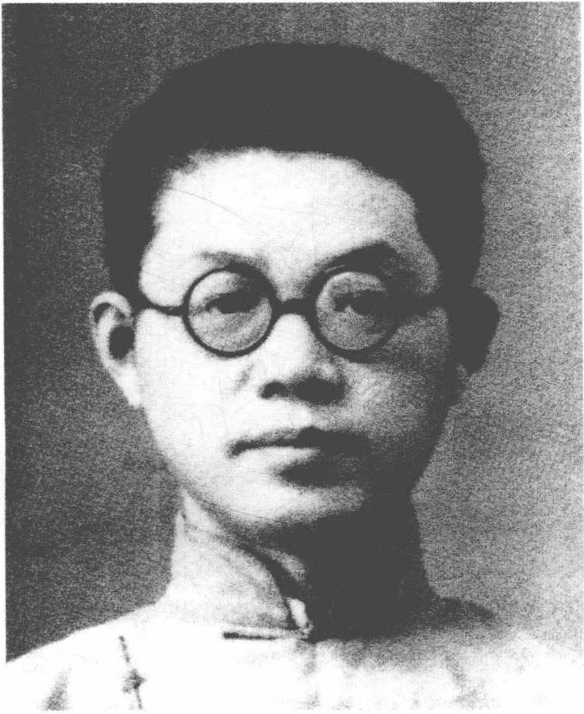
张岱年先生摄于1936年