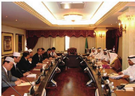
◎中国朝觐团与沙特朝觐部官员商谈朝觐相关事宜

中国穆斯林朝觐事务由国务院宗教事务部门主管，朝觐活动由中国伊斯兰教协会统一组织，有关省、市、自治区和外交部、公安部、工商、海关、民航、外