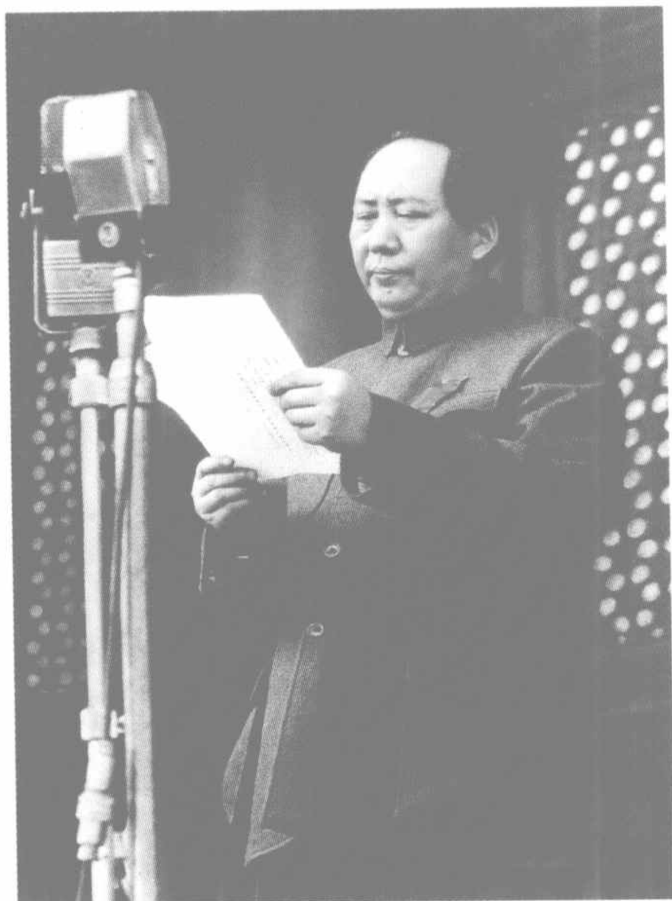
1949年10月1日毛泽东在开国大典上

改革开放伟大事业，是在以毛泽东同志为核心的党的第一代中央领导集体创立毛泽东思想，带领全党全国各族人民建立新中国、取得社会主义革命和建设伟大成就以及艰辛探索社会主义建设规律取得宝贵经验的基础上进行的。新民主主义革命的胜利，社会主义基本制度的建立，为当代中国一切发展进步奠定了根本政治前提和制度基础。 以毛泽东为代表的中国共产党人，领导中国人民经过 28 年艰苦卓绝的奋斗，夺取了新民主主义革命的胜利，进而建立起社会主义基本制度，把一个一百多年来饱受帝国主义掠夺和奴役的国家，变成了一个享有独立主权的国家；一个原来四分五裂的国家，变成了一个除台湾等岛屿外实现统一的国家；一个原来人民备受欺凌和压迫的国家，变成了人民当家做主、享有民主权利的社会主义国家。这场中国有史以来最伟大的革命，开辟了中国历史的新纪元。新中国成立后，以毛泽东同志为核心的党的第一代中央领导集体，面对旧中国留下的千