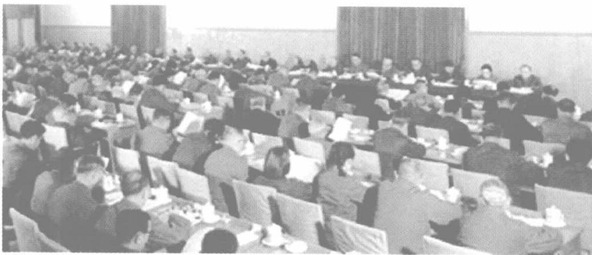
党的十一届三中全会会场

1978年12月召开的党的十一届三中全会，开启了改革开放的历史新时期，影响和改变了中国历史的发展进程，实现了伟大的历史性转折。从那时起，改革开放成为当代中国的主旋律。