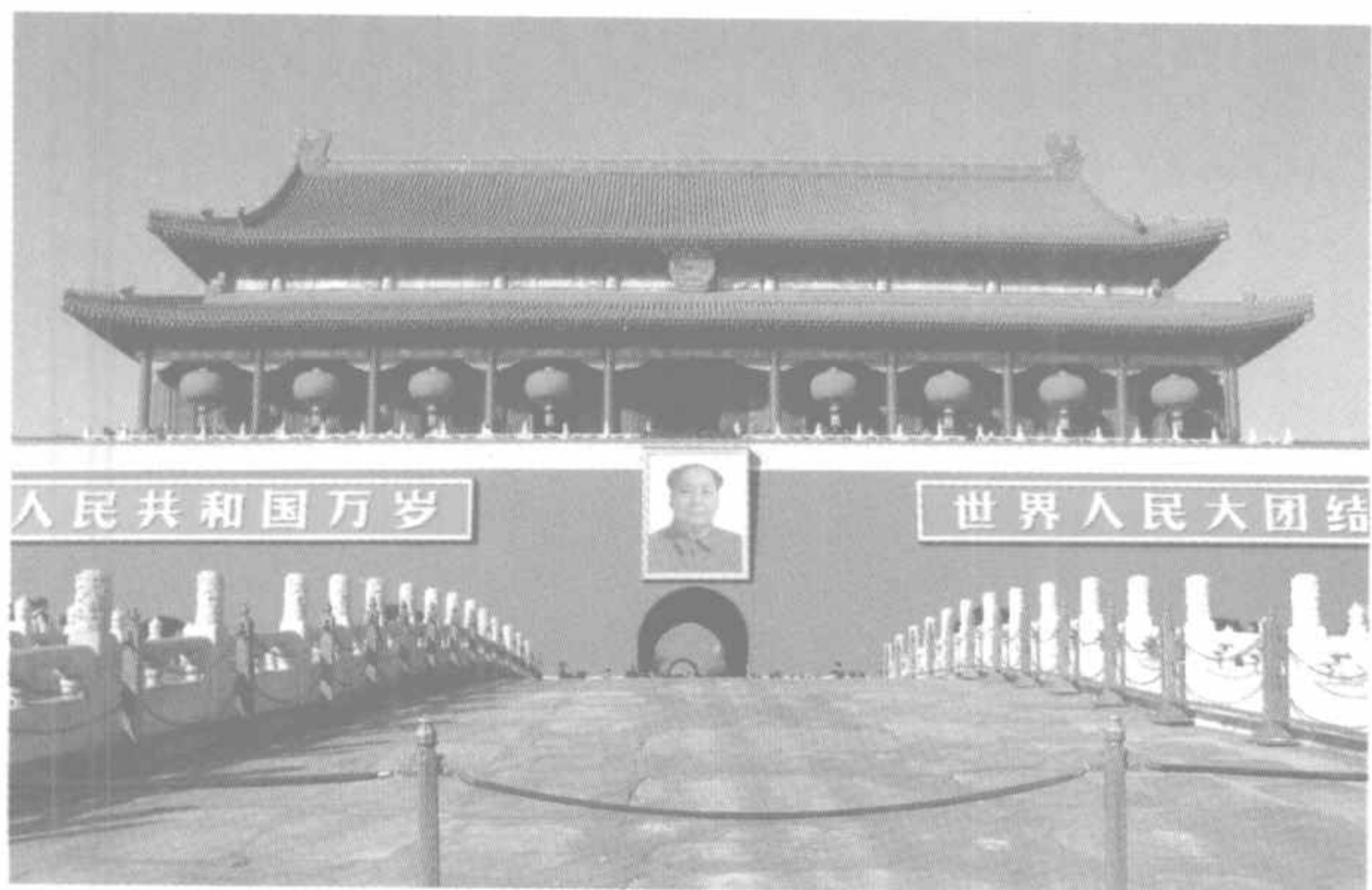
悬挂在天安门城楼上的毛主席巨幅画像

东巨幅画像。也许你不会想到，30年前，天安门城楼是否继续悬挂毛泽东画像，曾引起国内外许多人的关注。