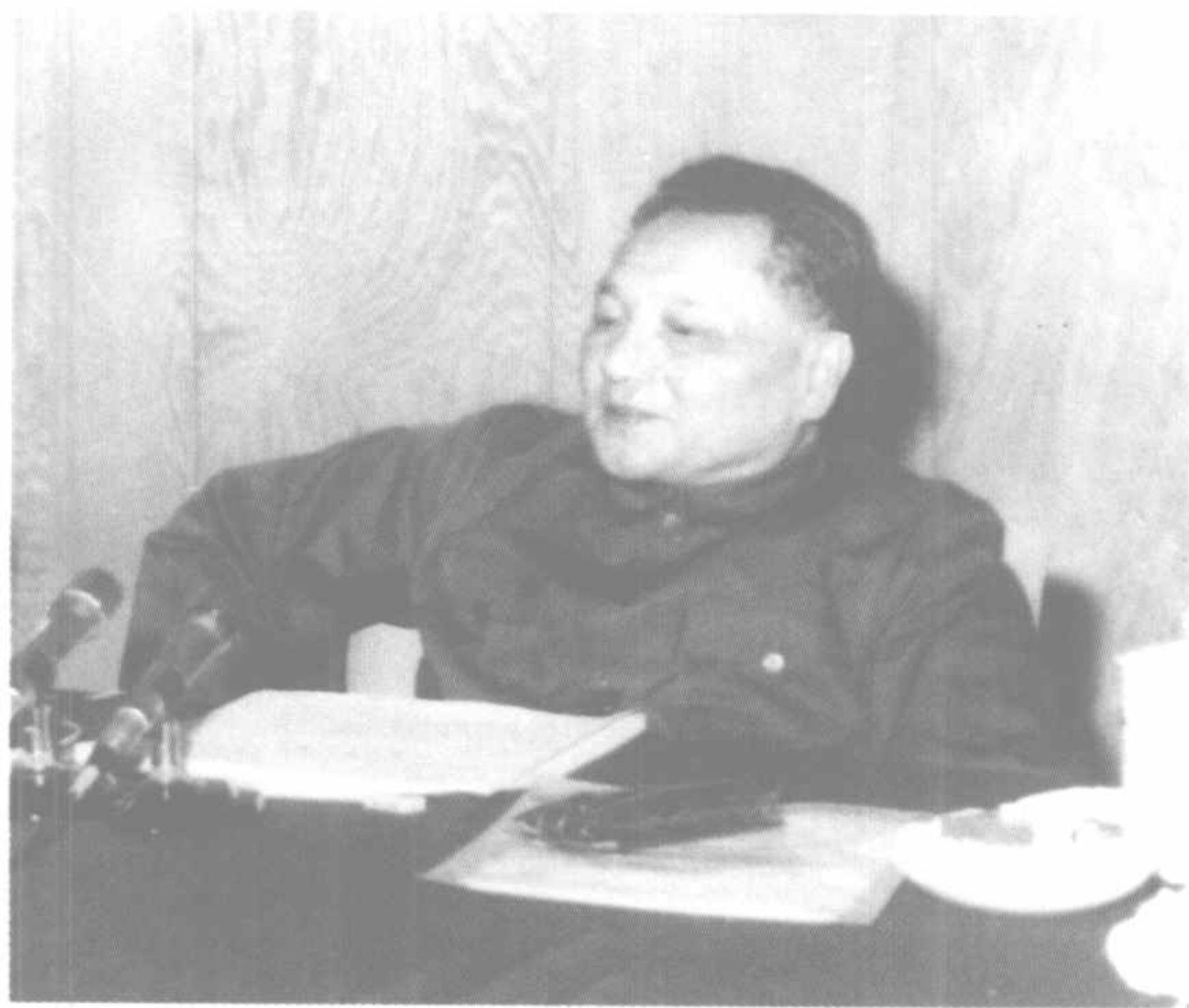
1978年12月邓小平在党的十一届三中全会上

1978年11月10日至12月15日，中央工作会议召开。按照原来的议程，会议主要是讨论经济问题。根据中央政治局的要求，在讨论经济议题之前，先讨论把全党工作的重点转移到社会主义现代化建设上来的问题。与会者畅所欲言，展开了热烈讨论，认为中央政治局关于工作重点转移的决策完全正确、非常及时，但必须解决