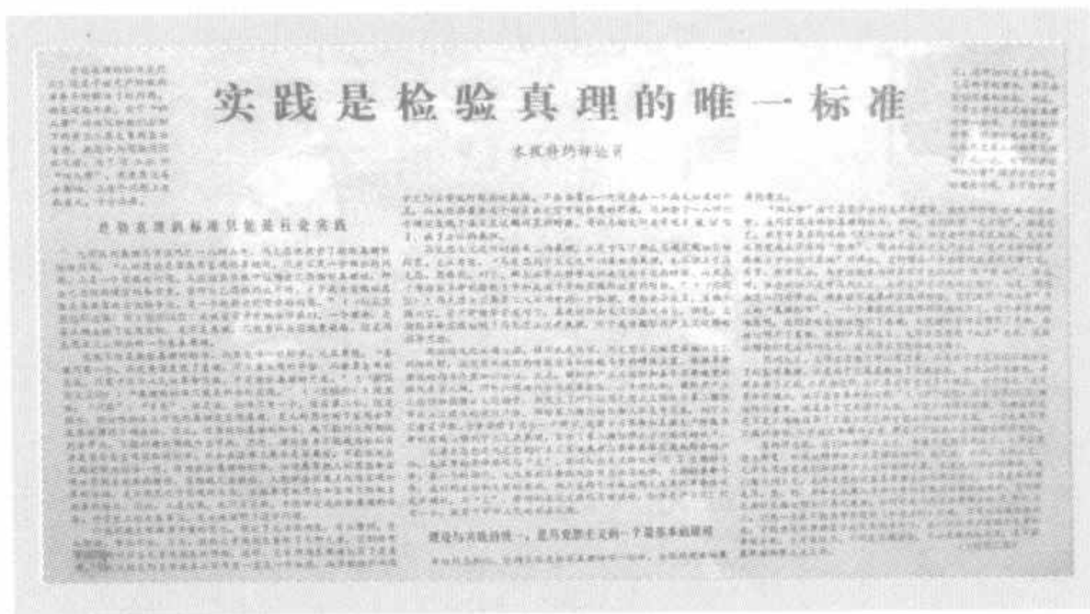
刊有《实践是检验真理的唯一标准》文章的《光明日报》

邓小平对真理标准问题的讨论给予了高度关注、坚决支持。1978年6月，他在全军政治工作会议上指出，有一些同志天天讲毛泽东思想，却往往忘记、抛弃甚至反对毛泽东同志实事求是、一切从实际出发、理论与实际相结合的这样一个马克思主义的根本观点、根本方法。按照实际情况决定工作方针，这是一切共产党员所必须