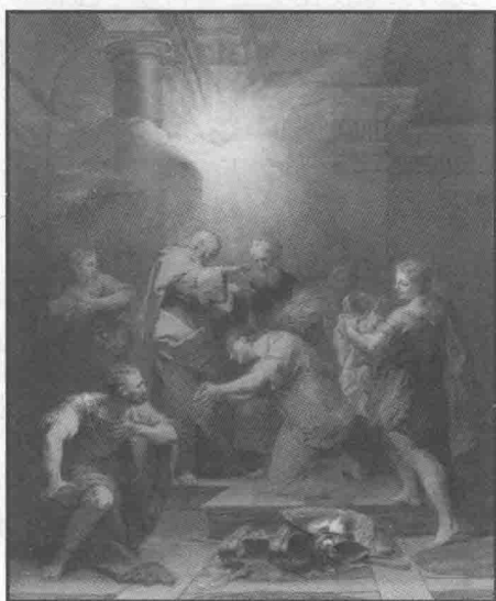
“亚拿尼亚使保罗眼睛复明”——《使徒行传》9:18

[油画/简·II·雷斯图 (Restout, Jean II, 1692—1768), 法国画家, 创作于 1719 年]