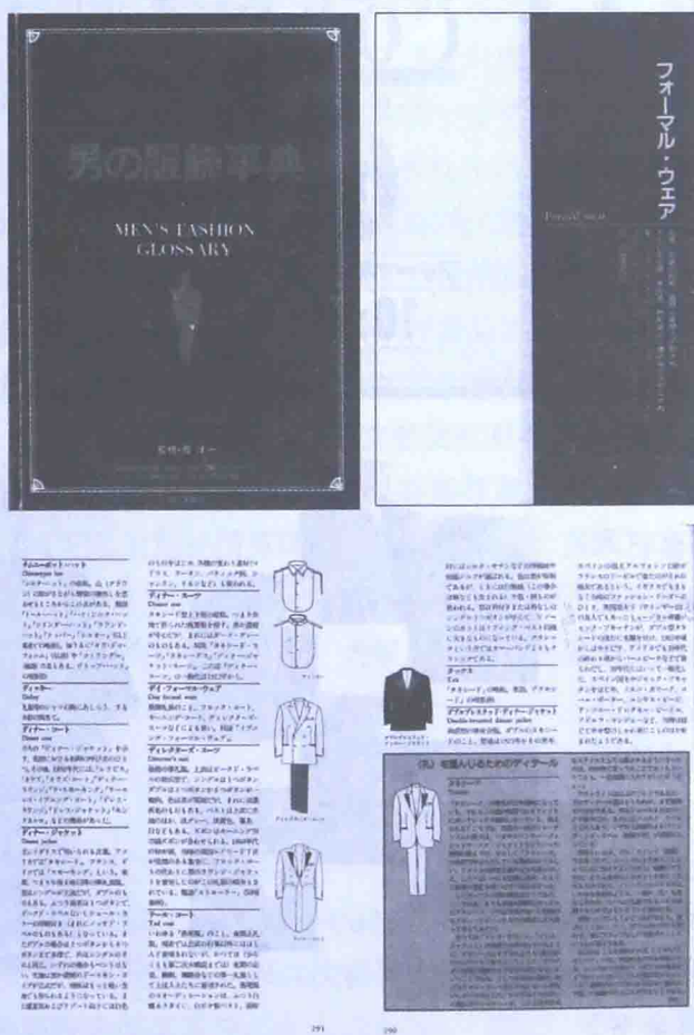
图 1-2 日本男装知识普及类百科全书《男の服飾事典》

以说是目前为止最为权威、最为系统、最为详尽的男装辞书类专著。它从礼服、西服套装、运动夹克、布雷泽西装、衬衫、针织衫、外套、户外服、工装夹克、裤子、帽子、鞋、首饰等各个服饰类别分章进行系统的介绍。涉及了礼服每一类别的名称、分类、形制、历史流变等考案和权威信息。与其他男装类专著不同的是，这本书由于定位在辞书类，它每部分的内容都是以绅士着装密码锁定的词条形式出现，对每个大的服饰类别进行了全面的梳理，列出了历史当中所有出现过的该品类的形制、名称等重要信息，具有不可替代的系统性、可靠性和权威性。这本《男装百科全书》还有一大特色就是对历史中出现过的名绅进行了专门的介绍，并具体阐述了他们对当时男装时尚的影响和形成今天“绅士规则”的掌故、历史事件。这本书不仅是日本男士品位着装的指南，事实上它已成为研究绅士着装密码的启蒙读物（图 1-2）。