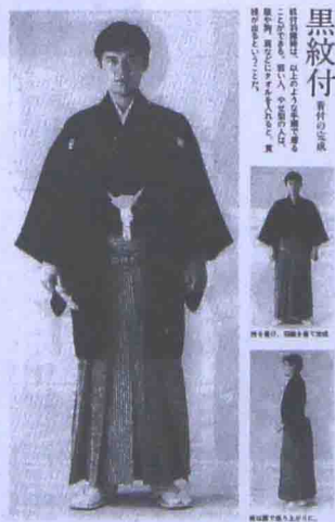
图 1-1 日本妇人画报社书籍编辑部出版的 The Dress Code （《礼服强执 10 条》）