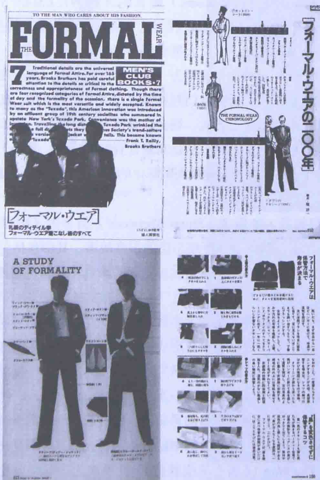
图1-3 日本妇人画报社编辑部出版的分项男装礼服读本

与英国为代表的欧洲国家和美国的男装专著相比,日本的礼服文献更加具有深刻性、知识性、系统性和符合东方人的阅读习惯。从百科全书《男の服飾事典》、