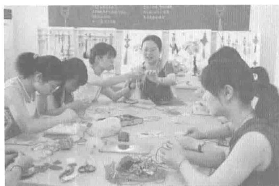
教师教育学院手工技能课