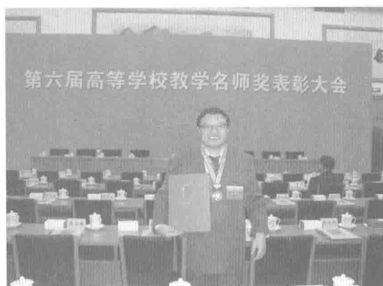
刘太顺教授喜获国家级教学名师奖