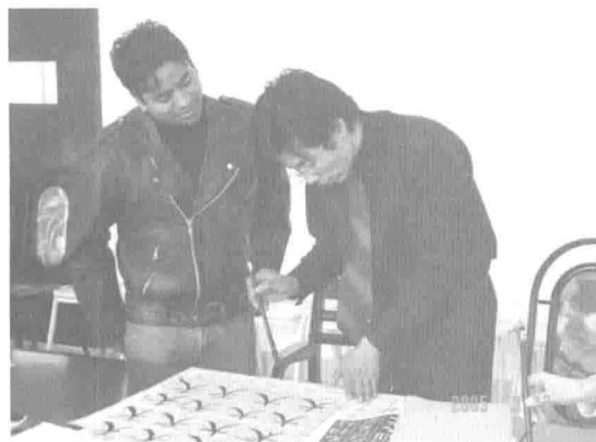
教学：留学生教育书法