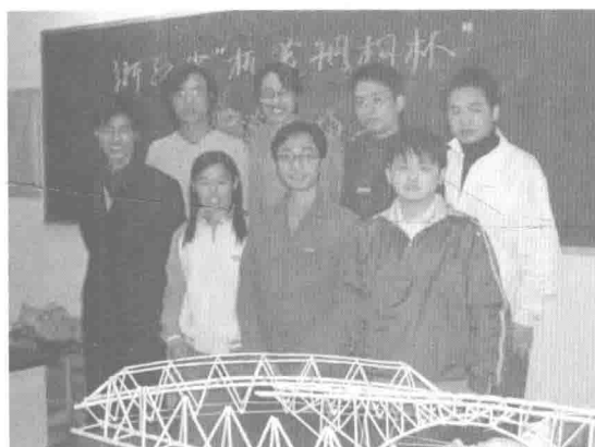
理学院 01 级学生在获浙江省“杭萧钢构杯”桥梁设计比赛中的获奖作品的制模现场