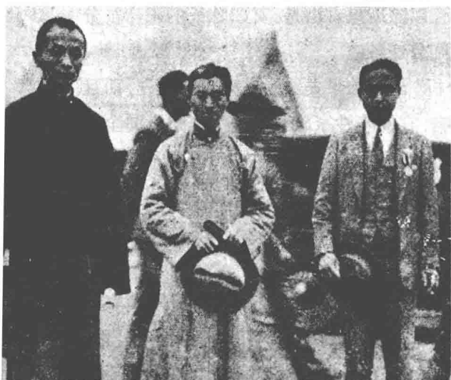
与陈立夫(右二)、朱家骅(右一)合影，1940年摄

俗话说，“一方水土养一方人”。山地之人，性多强悍，水乡之人，性多阴柔，而陈果夫生于山水之间，其性虽崇尚阴柔，却又柔中寓刚，刚柔相济，至柔至刚，又是一种性格类型。湖州为江南名城，地处浙北边缘，太湖南滨。远处：天目山巍峨挺拔，云雾缥缈；太湖水烟波浩荡，水天一色。近处：东西苕溪，二水合流；六、毗、岷、蜀，四山环拱。如此倚山傍湖，山围水贯的美景，恰如一幅淡雅幽静的山水画卷，有如是自然天成的绝好去处，难怪陈果夫的祖先要把此处选为定居之地。