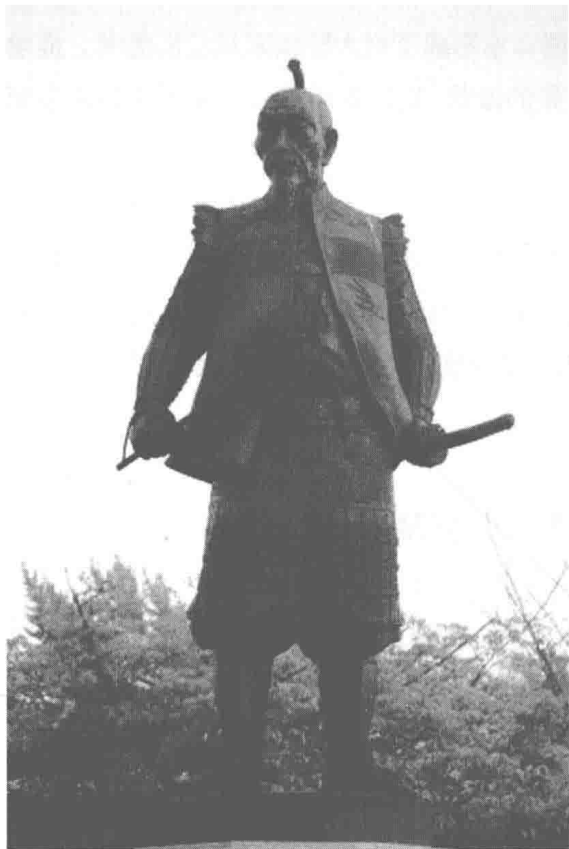
今大阪城内的丰臣秀吉像

1578年,他奉织田之命率师征伐播磨国时说:“图朝鲜,窥视中华,此乃臣之素志。”