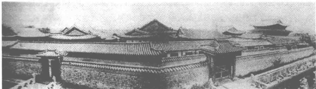
朝鲜李朝时期的景福宫,为政治权力中心

战。但时任内阁要臣的伊藤博文等人认为,日本国力还不够,应积蓄力量,“速节冗费,多建铁路,赶添海军,待三五年后日本官商充裕时,再视中国情形而定”。天皇采纳了后一种意见,决定以打败中国为目标加紧扩军备战,等待时机再卷土重来。为此,日本开始实施以十年为期的扩军计划,军国主义的狂热在日本甚嚣尘上。