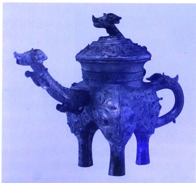
兽面纹龙流盃（春秋中期，上海博物馆藏）