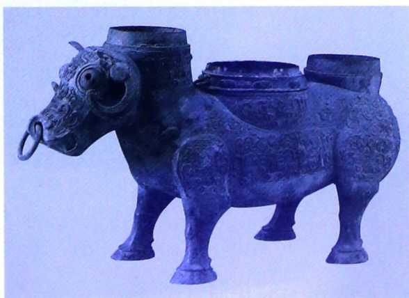
牛尊（春秋晚期，一说西周早期，上海博物馆藏）