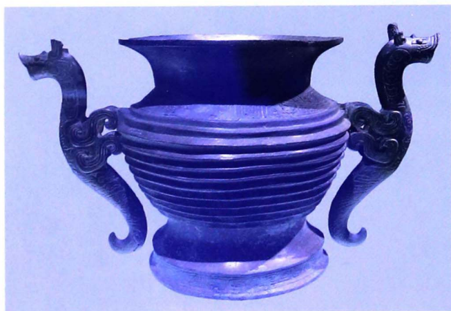
龙耳尊（春秋早期，上海博物馆藏）