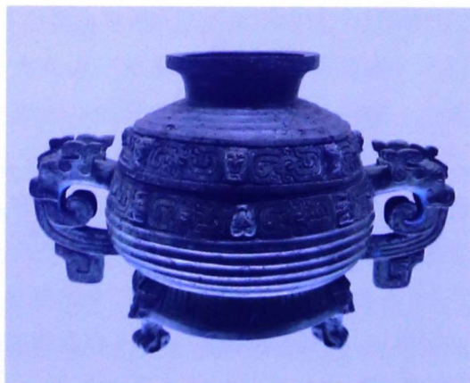
秦公簋（春秋早期，上海博物馆藏）