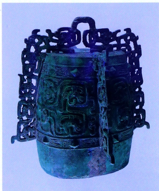
秦龙纹繁钮秦公铸（春秋早期， 上海博物馆藏）