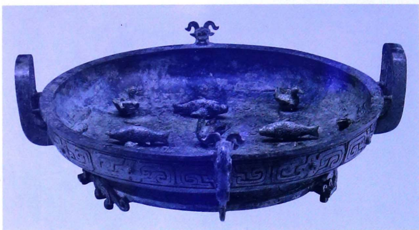
春秋子仲姜盘（春秋早期，上海博物馆藏）