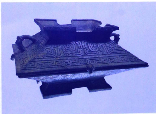
山奢虎簠（春秋早期，上海博物馆藏）