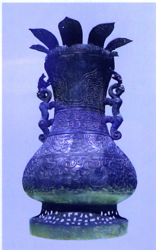
莲瓣盖龙纹壶（春秋中期， 上海博物馆藏）