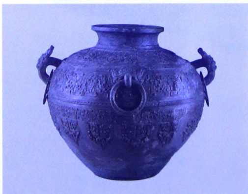
夔凤纹罍（春秋晚期，山西省考古研究所藏）

注：封面彩图为明仇英绘《圣迹图》之一。插页彩图未注明出处的均引自顾德融、朱顺龙著《春秋史》（上海人民出版社2003年版）。