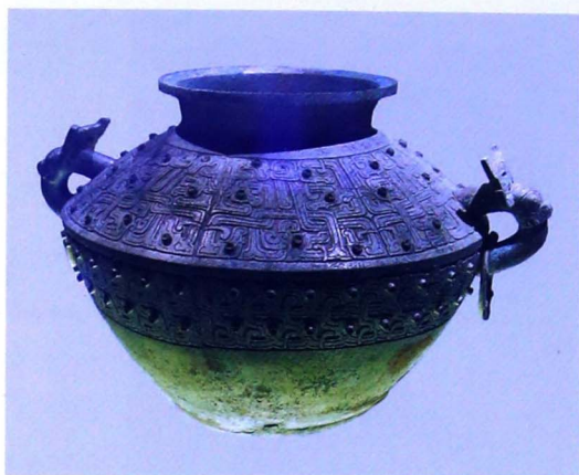
伯游父鬲（春秋中期，上海博物馆藏）