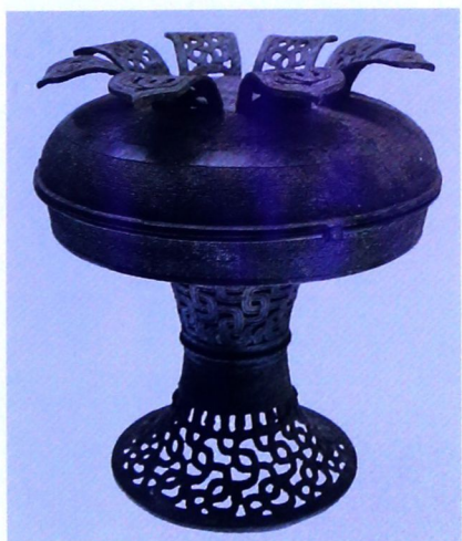
透雕交龙纹铺（春秋晚期，上海博物馆藏）