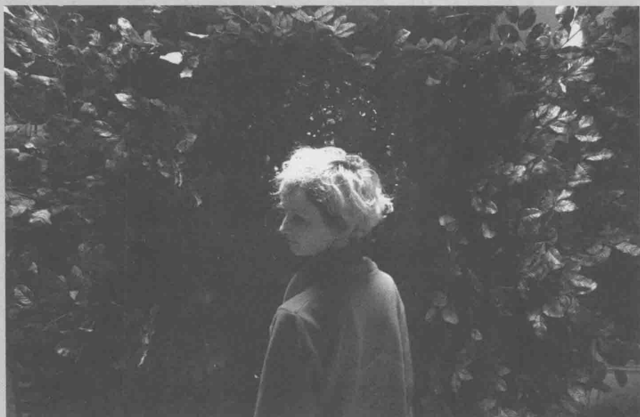
《质数的孤独》（ La solitudine dei numeri primi , 2010）