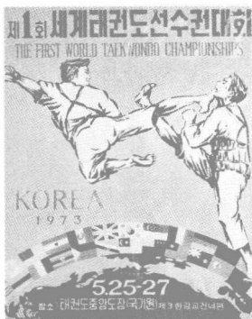
图 1-1-1 第1届世界跆拳道锦标赛

基于韩国政府的支持，通过金云龙的积极努力，1972年建立了韩国跆拳道中央道馆国技院，1973年5月成立了世界跆拳道联盟（The World Taekwondo Federation，简称WTF），金云龙任主席（2004年赵正源当选主席）（图1-1-2），这些举措为跆拳道国际化发展，成为奥运会正式项目打下了良好的基础。