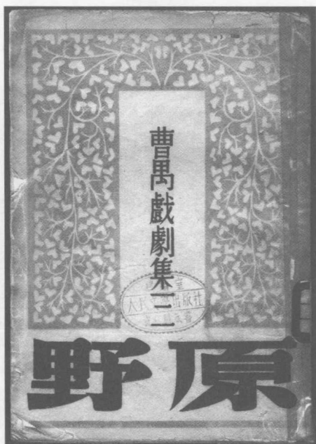
文化生活出版社1950年版《原野》书影