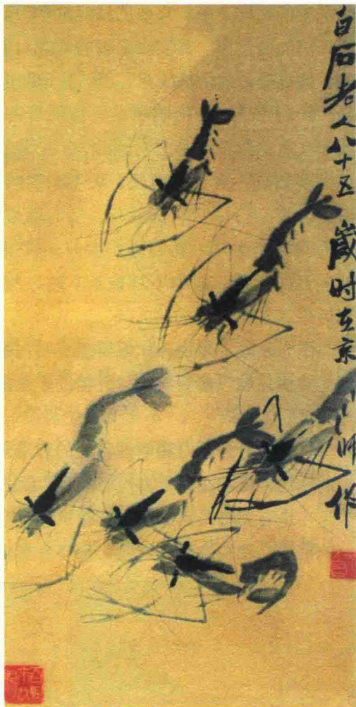
↑ 虾 齐白石 / 现代

从收藏的角度看，近现代书画因其年代原因，在民间还留存有相当大的数量，而不像古代书画那样，基本都留存于海内外各大博物馆，使收藏者望洋兴叹。更重要的是，相对于古代书画而言，由于可借助的手段非常丰富便捷，近现代书画作品的鉴定是比较容易的。而且，在收藏市场上，近现代书画已经经过市场多年的考验，可以说已形成一个非常成熟的收藏群体和圈子，在艺术市场方面有一个非常完备的流通渠道。所以说，收藏中国近现代名家的代表作品有非常广阔的前景，同时也是比较容易入手的一个收藏门类。近年来拍卖市场