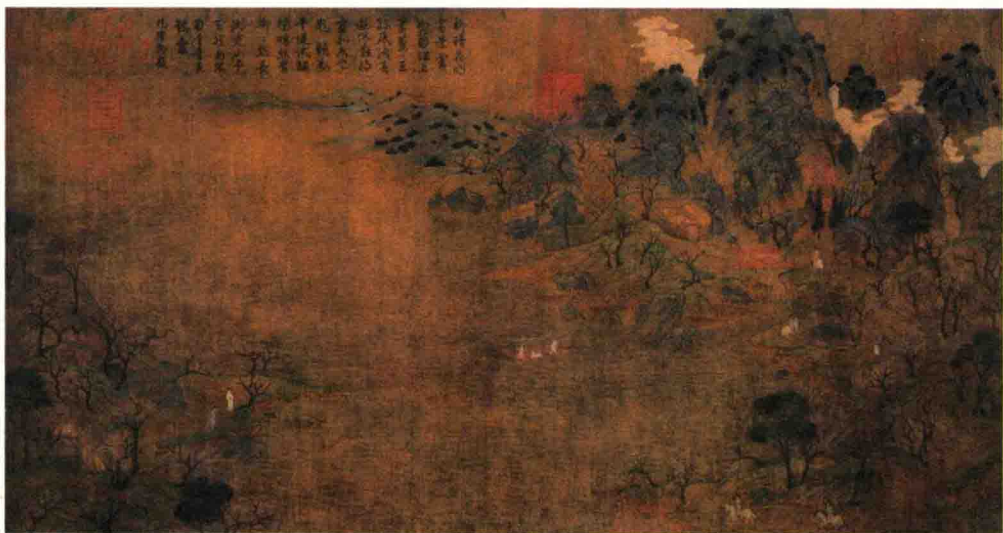
↑游春图 展子虔 / 隋