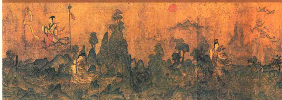
↑洛神赋图卷（局部）顾恺之 / 东晋

中国绘画史上经典之作，构思巧妙，人物刻画如行云流水。《洛神赋图》取材于曹植名篇《洛神赋》，表现作者由京师返回封地的途中与洛水女神相遇而爱恋的故事。全图采用长卷形式，分段描绘赋中情节：开始是曹植在洛水边歇息，女神凌波而来，轻盈流动，欲行又止；接下来表现女神在空中、山间舒袖歌舞，曹植相观相送的情景；最后女神乘风而去，曹植也满怀惆怅的上路。各段之间用树石分隔，并以舟车无情地飞驰离去反衬人物的依依不舍之情，极为传神。人物刻画如行云流水，用笔细劲古朴，柔韧如蚕丝；神态表现细腻，设色厚重鲜艳。山川树石画法稚拙，反映了山水画初创时期“人大于山”、“水不容泛”的特征。