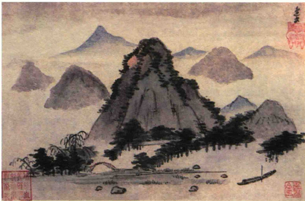
↑心赏图册（其一）姚绶/明

一是有关书画家的字号、籍贯和生卒时间等情况。如果收藏者能够熟记书画家的字号、籍贯和生卒时间，那将在鉴定时发挥关键作用。实际上，因为这些问题