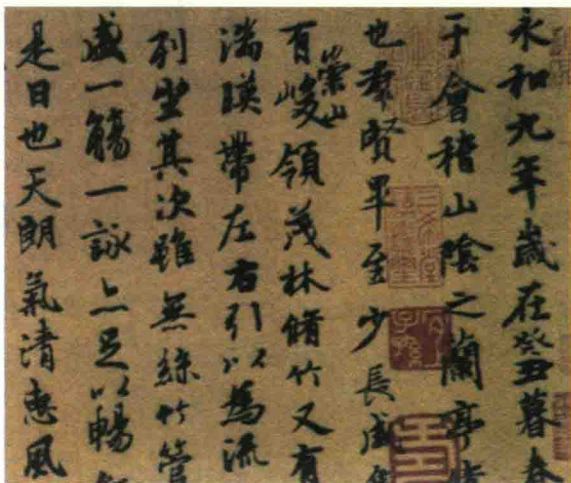
↑ 神龙兰亭序帖卷（局部）王羲之 / 东晋

中国书法是运用毛笔为工具的一种借线条表现汉字的艺术，它源远流长，起始于商代，成熟于东周；两晋和隋唐时代书家辈出；宋、元、明书法以晋唐法度为契机，不断创造新技法和新意境，涌现出丰富多姿的个性风格和书艺流派；清代书法家广泛汲取前代书法养料，崇尚北碑之学，熔凝出新的风格。