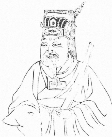
锦麟桥范氏始祖范履冰像

质疑：“我怀疑我们姓范的都是范仲淹的子孙，从家谱上看我也出自范仲淹。北宋时姓范的很不少，为什么别人都没有后代，只有范仲淹子孙独多呢？显然，这是因为他的名气大，有文正公的美谥，大家都愿意尊奉他，这样一来，就逐渐都变成他的子孙了。” ① “范家台门”位于锦麟桥南堍，背靠卧龙山（即府山），与北岸的大通学堂隔环山河相望，台门门楣上方悬挂“清白世家”匾额，为范氏传承清白家风的写照。台门坐南朝北，为三进三开间平房，第一进为门厅，第二进为范氏族用房，第三进为范文澜一家居所，穿斗式结构，前槽单步梁檐廊。正屋前是石板铺就的小天井，天井前砌墙并建门斗，左、右各有三间小侧厢。每年正月初一，范家在明间正厅悬挂范仲淹画像，两边则挂“责己恕人循祖训，先忧后乐传家风”对联，范家老小虔诚跪拜。正屋后为一小花园，花木扶疏，清静幽雅。