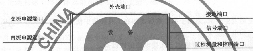
图 1 端口举例