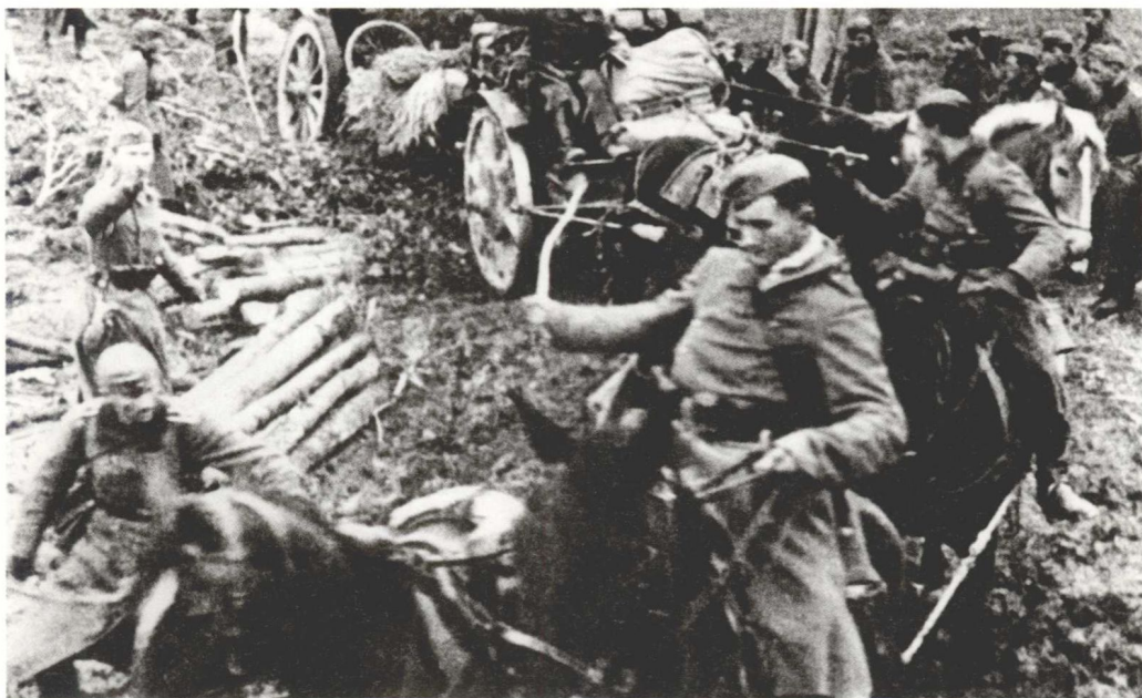
10.5 厘米口径 18 型轻型野战榴弹炮（leFH 18），这是纳粹德国陆军的制式师级榴弹炮。如图，这种榴弹炮正在骡马的拖拽之下通过苏联境内的一个高低不平的路段。就摩托化步兵部队的情况而言，火炮的牵引工作通常是由 SdKfz 251/4 半履带装甲车等机动车来承担的。（Nik Cornish at www.stavka.org.uk ）

力跨过国境线入侵苏联；以普里皮亚特沼泽地（Pripet Marshes）为分隔线，德国部队分成南攻击群和北攻击群。北方集团军群的总攻击方向是列宁格勒，中央集团军群的攻击方向是明斯克—斯摩棱斯克—莫斯科，南方集团军群将朝乌克兰境内的基辅推进。这 3 个德军集团军群的中心任务是消灭苏联的武装部队，然后占领一些具备