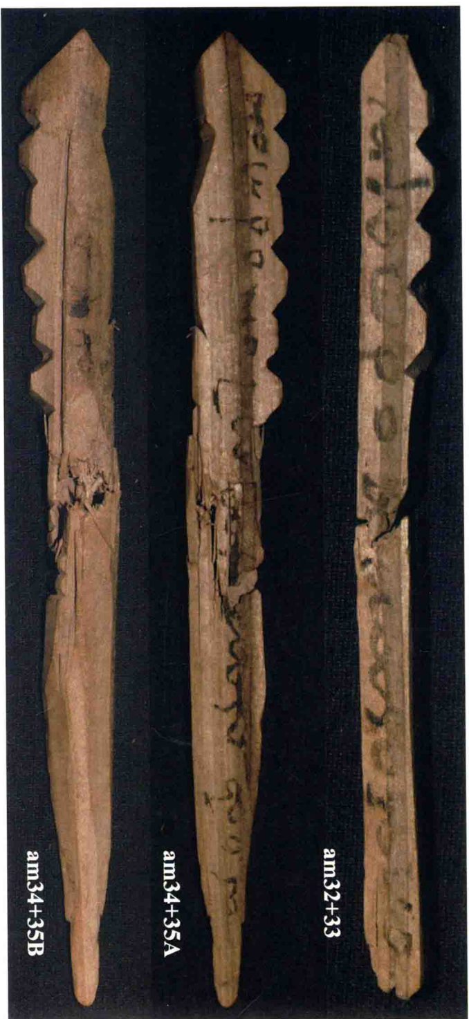
图版4a: 文书am32+33和am34+35, 木符。