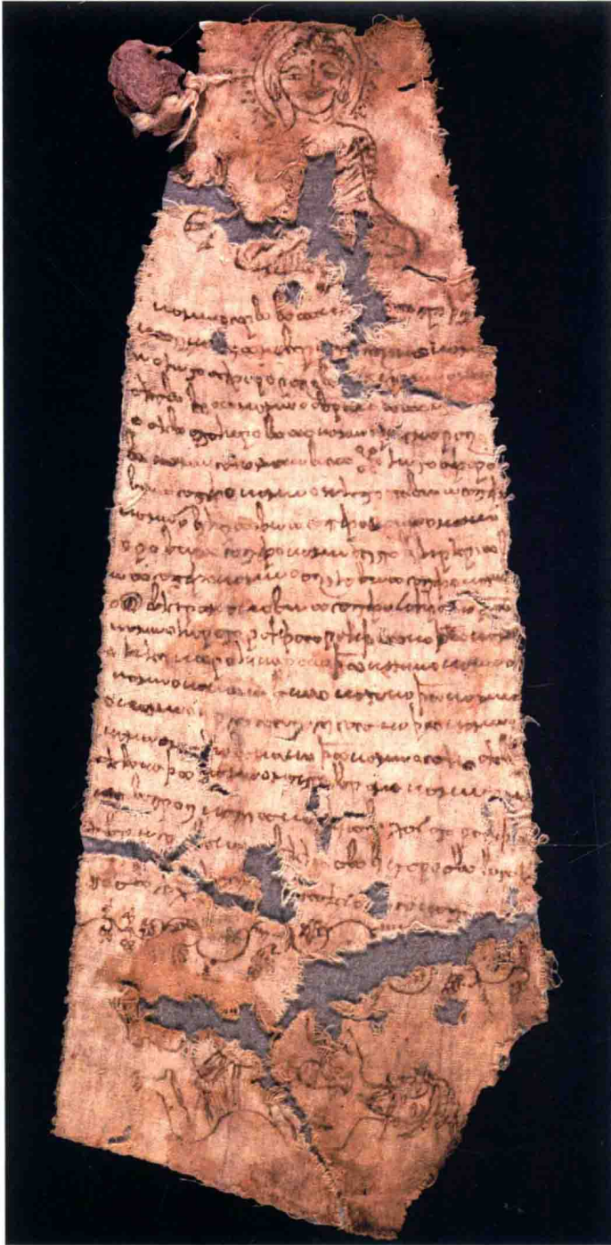
图版3b: 文书za, 佛教文书。