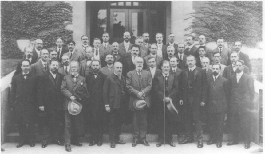
1909年，弗洛伊德在美国克拉克大学与美国心理学会会员合影。此时，做了著名的《精神分析五讲》报告，并发表于《美国心理学杂志》。