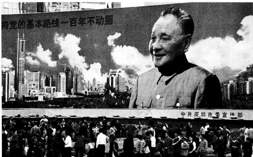
位于广东深圳福田区深南大道北、荔枝公园东南口的巨幅邓小平画像，是深圳的标志之一。