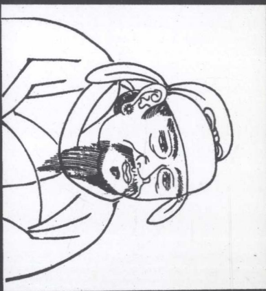
■李靖像——日本慶長版「君臣圖像」。為唐太宗征伐東突厥、吐谷渾，立下武功。李靖的事蹟，在唐代時已被神格化，宋元以後，更被提昇為「托塔天王」。