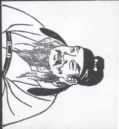
■李勣像——明版「君臣像贊」。初為王世充部下，後歸順太宗，在禦外戰爭中立下大功。