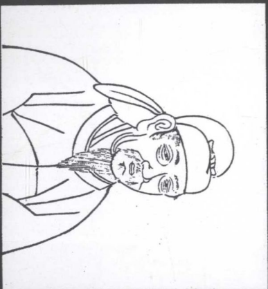
左圖■房玄齡像——日本慶長版「君臣圖像」。為太宗創立王朝，設計藍圖，對太宗之即位，有無比功勞。