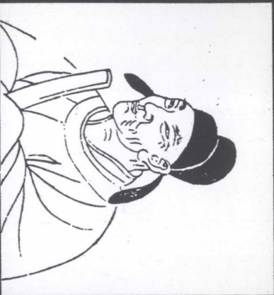
■魏徵像——明版「君臣像贊」。魏徵雖為道士出身，但輔佐太宗對文化方面也有莫大業績。