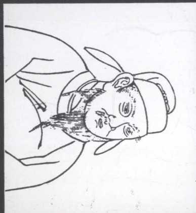
右圖■杜如晦像——日本慶長版「君臣圖像」。與房玄齡輔佐太宗，並稱房杜。