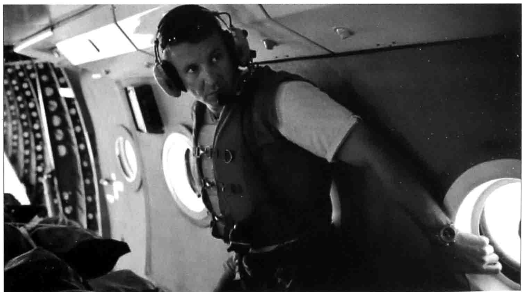
本书作者正准备向驻扎在阿富汗—巴基斯坦边境上的美军空投物资。