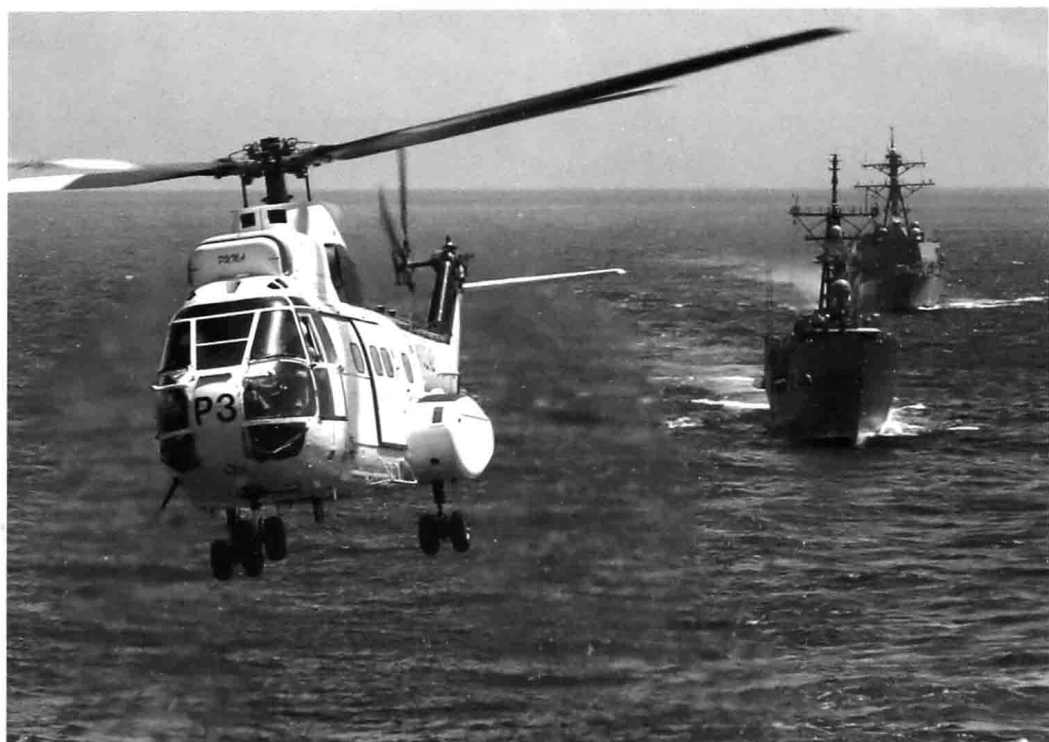
一架黑水公司的“美洲豹”直升机正在为美海军舰艇进行海上垂直补给。