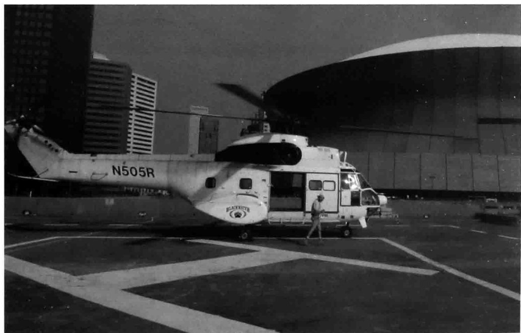
一架黑水公司的美洲豹牌直升机降落在新奥尔良超级圆顶体育馆的停车场上，前来解救卡特里娜飓风灾难中的被困民众。