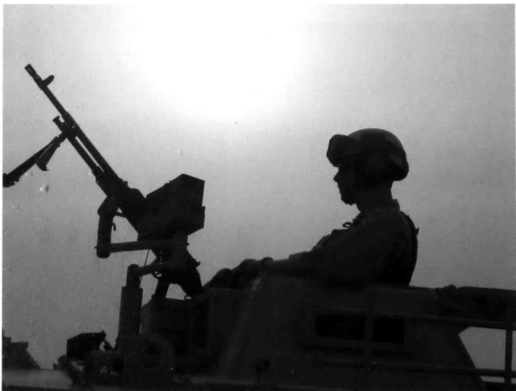
黑水公司的一名枪手正在全球最危险的公路（巴格达市中心至国际机场）上执行警戒任务。