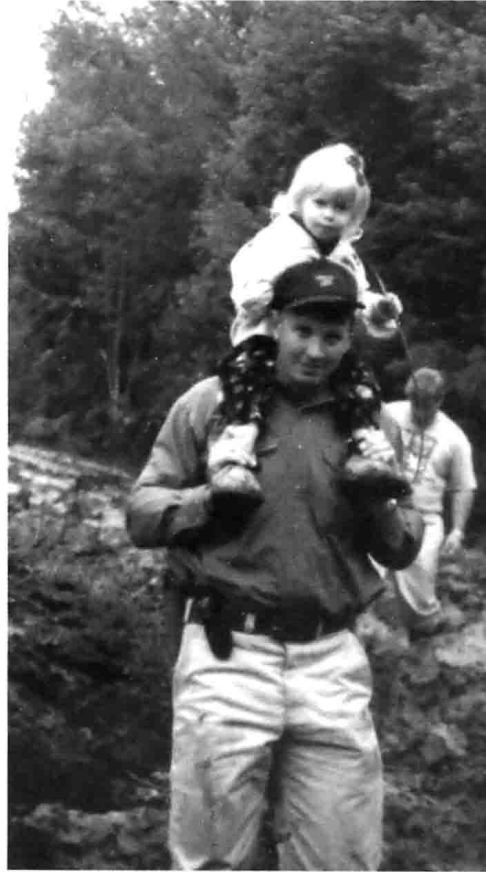
1997年，我带着女儿一起散步。当时我们正在开始组建黑水公司，像这种穿过大迪斯默尔泥泞沼泽地散步的次数并不多，我们未来训练中心的名字也呼之欲出。