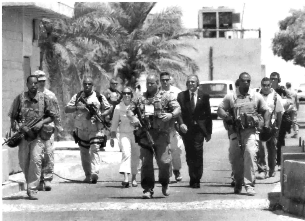
黑水国务院人身安全特遣队员保护大使在社区中漫步。