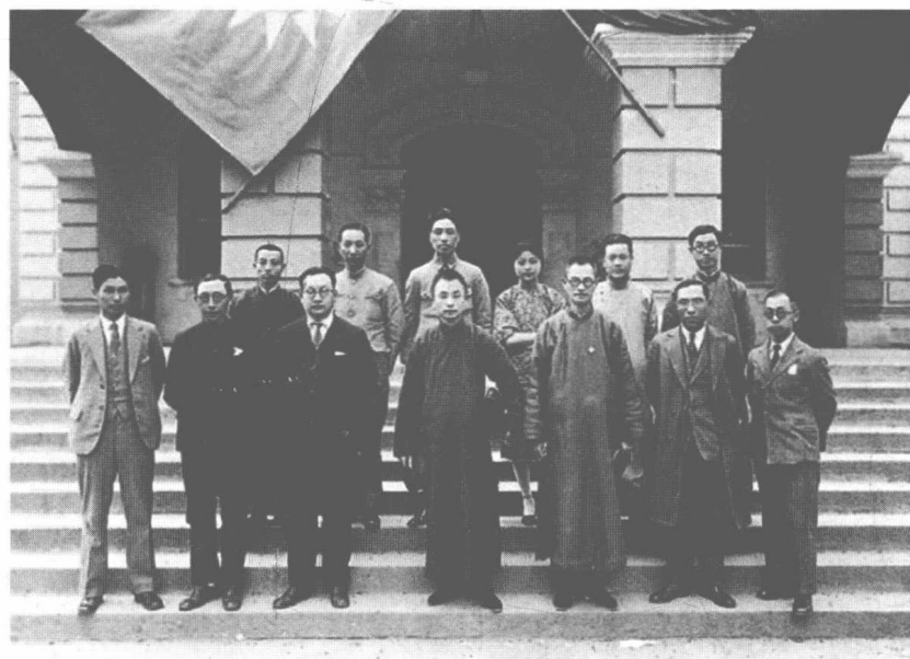
时任教育部长的蒋梦麟（前排右三）与同仁合影（1929年）