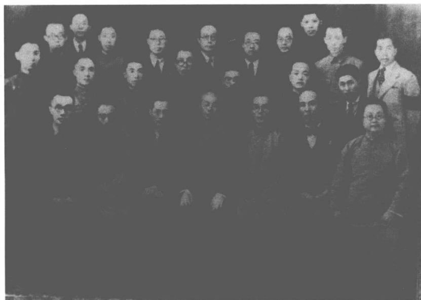
蒋梦麟（前排左三）与西南联大部分教师合影