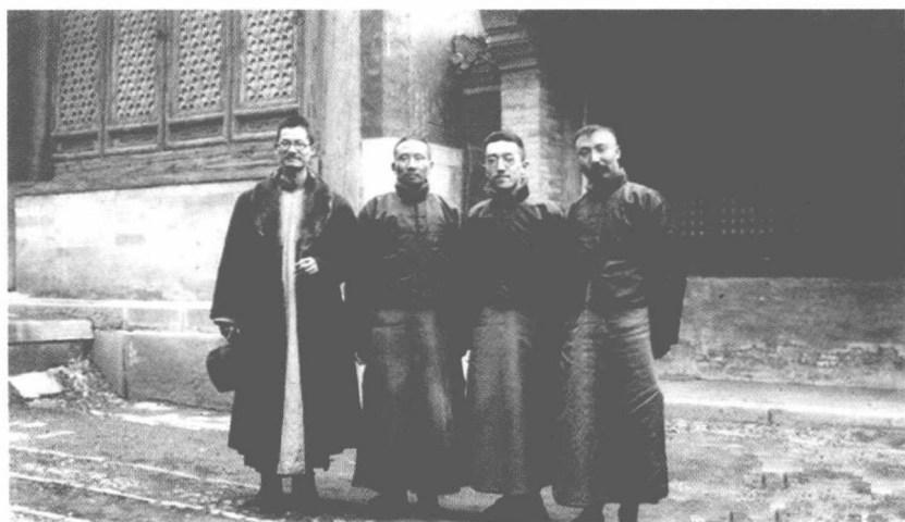
左起：蒋梦麟、蔡元培、胡适、李大钊（1920年）